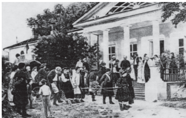
Бодаревський М. Весілля в Україні. (Понеділок. Молоді у поміщика). 1881 р.

Софію Василівну писав і відомий український художник М.Бодаревський. Його “Гетьманова” є парою “Гетьману” І.Рєпіна. На жаль, місце знаходження картини не встановлене і дані про неї черпаємо лише із спогадів Г.Лазаревського: “... на тлі багатого оздоблення покою відпочиває на лаві ясновельможна в синьому кунтуші ... Кораблик прикрашає вродливу голівку. Але бліде, неначе пудрою присипане личко, сумні сірі очі під чудесними соколиними бровами – очі хворої” 5 . Портрет був написаний незадовго до її смерті, найвірогідніше, у 1886р., коли, як свідчить автограф в альбомі, художник жив і працював в Качанівці. Швидше за все, тоді ж написані й жанрові картини “Молебень біля криниці” (знаходиться в НХМУ) та “Весілля в Малоросії” (зберігається в ДРМ). На останній