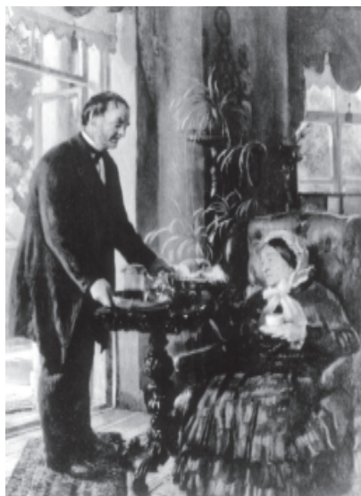
Маковський К. Поміщиця. 1877–1880 рр.

Як свідчать літературні джерела, в Качанівці К.Маковський малював й дітей Тарновських – Васючка і Соню. Можливо, портрет дівчинки, який нещодавно за кордоном був проданий правнучкою художника у приватну колекцію, і є згаданим портретом Соні 3 . Цю думку підтверджує і авторський напис у правому верхньому куті картини: “Костантин Егорович Маковский. Качановка. 1884” і вік портретованої, що зорозово співпадає з віком дочки Тарновських. Ще меншою дівчинка зображена на полотні “В майстерні художника” (Третьяковська галерея).