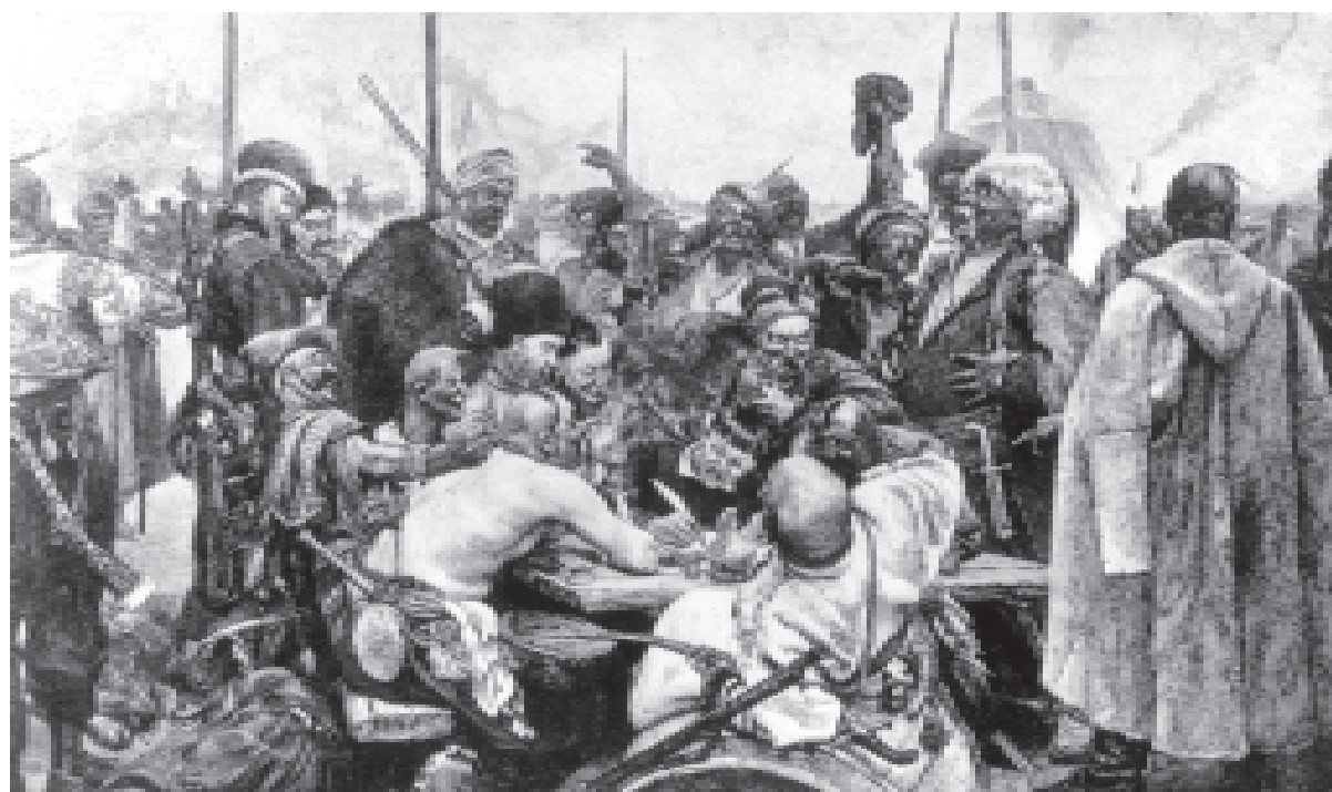
Репін І. Запорожці пишуть листа турецькому султану. 1878–1891 рр.