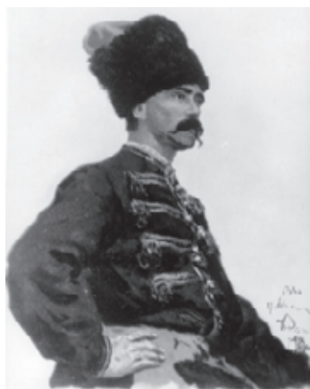
Репін І. Тип козака. 1880 р.

Відомий колекціонер і меценат зображений і на етюді І.Репіна “Козак” з зібрання Третьяковської галереї, який атрибується як портрет В.Тарновського. Це поясне зображення Василя Васильовича в козацькому вбранні зі схрещеними руками. Внизу малюнка праворуч напис: “Качановка. 5 септєбря. 80 г. И. Репин”. Малюнок виконано графічним олівцем з розтушовкою.