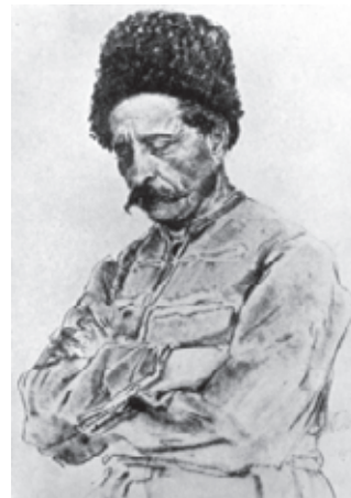
Репін І. Козак. 1880 р.

цом. Спираючись на її ствол, він вдивляється в далечінь. Вдало знайдена поза, вольове обличчя, суворий погляд очей з-під нахмурених брів, червоного кольору козацьке вбрання надають особливої виразності образу запорізького воєначальника. Від нього віс енергією, рішучістю людини, яка усвідомлює свої дії і впевнена у своїх силах. За глибиною передачі психологічної характеристики ця робота є одним з найкращих зображень В.Тарновського. Вона широко відома і багато разів відтворювалась. Вперше її репродукували ще за життя Василя Васильовича в С-Петербурзі у 1892 р.