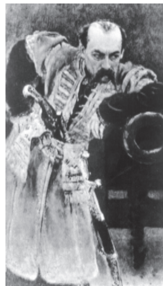
Рєпін І. Гетьман. 1880-і рр.