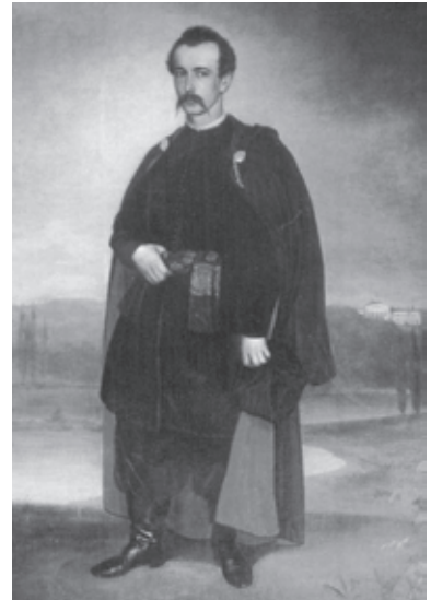
Горонович А. В. В. Тарновський-молодший. 1866 р.

Портрети, виконані олійними фарбами на полотні, суттєво різняться між собою. Один з них, досить значних розмірів – 205x142 см, подає Тарновського на повний зріст. Датується картина 1866р., часом коли Василь Васильович успадковує Качанівську садибу і стає її повновласним господарем. Певне це й обумовило появу даної роботи і звернення художника до традицій стародавнього українського репрезентативного портрета. Репрезентативність простежується і в статистичності пози, і в характерній постановці портретованого в одязі козацької старшини. Молодий 29-річний аристократ постає перед глядачем на фоні качанівського пейзажу зі ставками, парком і палацом в глибині картини. Таке вирішення пейзажу підсилює представницьке призначення портрета, і в той же час портрет несе в собі елементи характеристики героя, акцентуючи його захоплення українською старовиною.