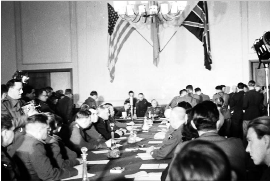
Зал під час церемонії підписання Акта про беззастережну капітуляцію. м. Берлін (Карлсхорст), 8 травня 1945 р.