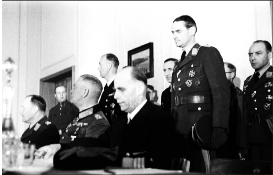
Делегація Німеччини в залі під час церемонії підписання Акта про беззастережну капітуляцію збройних сил Німеччини. Справа наліво (сидять) Г. Фрідебург, В. Кейтель та Г. Штумпф. м. Берлін (Карлсхорст), 8 травня 1945 р. З фондів ЦДКФФА України ім. Г. С. Пиленічного, од. обл. 0-231109