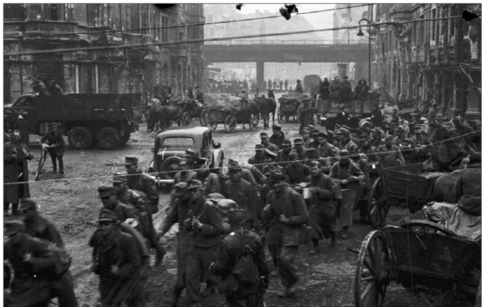
Німецькі військовополонені на вулиці м. Берліна.