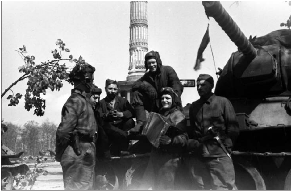
Екіпаж радянського танка Т-34 біля колони Перемоги в Тіргартенпарку в м. Берліні. 1 травня 1945 р. З фондів ЦДКФФА України ім. Г. С. Пшеничного, од. обл. 0-230854