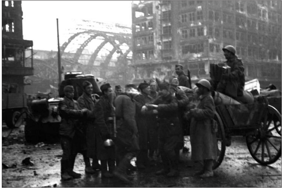
Радянські солдати святкують перемогу на одній з вулиць м. Берліна. 9 травня 1945 р.

З фондів ЦДКФФА України ім. Г. С. Пиєничного, од. обл. 0-230915