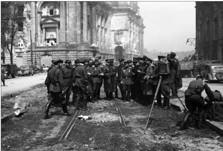
Радянські офіцери фотографуються біля стін рейхстагу в м. Берліні. 8–9 травня 1945 р. З фондів ЦДКФФА України ім. Г. С. Пшеничного, од. обл. 0-230911