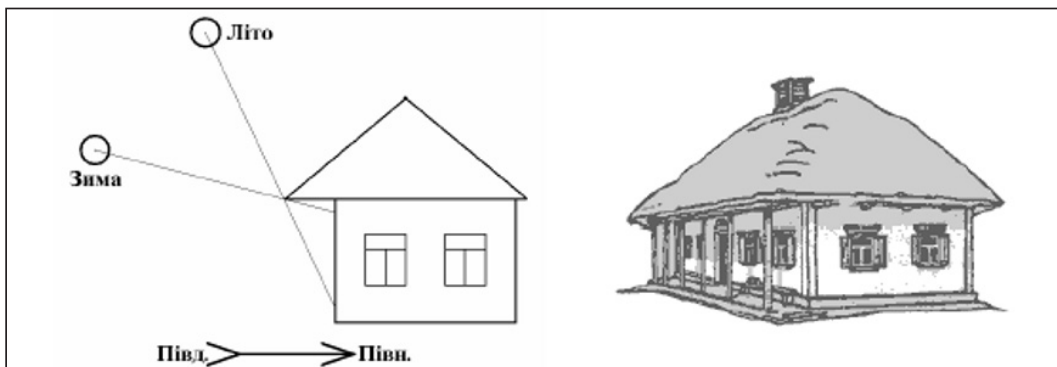
Рис.2. Застосування піддашків, характерних для українського будівництва минулих століть, як компонентів енергозбереження одноповерхових приватних будинків. Ліворуч: схема будинку з піддашком вздовж довшої частини будинку, орієнтованої на південь. Праворуч (рис. взято з [5]): хата в Новосанжарському районі Полтавської області

3. Для багатьох будинків минулого є традиційною наявність піддашки — суттєвого виносу даху з півден-