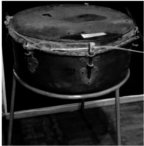
Мал. 1. Козацька литавра XVII ст.

Унікальними експонатами музею цього часу, а саме 1925 року стала срібна булава кінця XVI ст. За описом Д.І.Яворницького козацька булава являла собою палицю з горіхового дерева, завдовжки 50 – 70см., зі срібною чи визолоченою кулею на кінці, вона покривалася, як правило, бірюзою, смарагдом, перлами. Знахідка ж з с. Черкас складалася з шести квадратних клейм та двох окуттів руків'я, на яких було гравірування, що зображало моменти початку правління короля Речі Посполитої Сигізмунда III Вази [12,с.48]. Знахідку багатогранної булави під Білою Церквою науковці пов'язували з добою перших козацьких війн 90-х років XVI ст.