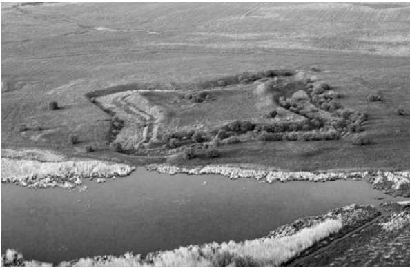
Рис. 4. Вигляд замчища з повітря

Аерофотозйомкою було охоплено цілий комплекс, що з землі неможливо було зробити. В результаті досліджень було отримано понад ста цифрових фотографій як самої фортеці, так і навколишньої території. Отримана за допомогою аерофотозйомки інформація надала можливість уявити місце укріплення в історичному і природному ландшафті, показала врахування будівничими природних умов та водних перешкод. У подальших дослідженнях цієї пам'ятки є необхідність провести аерофоторозвідку у різні періоди року. Такий підхід дасть змогу, за допомогою рослинних, тінювих та ґрунтових прикмет [12], виявити, можливо, нові об'єкти. В запланованій на 2012 р. аерофоторозвідці буде охоплена більша територія,