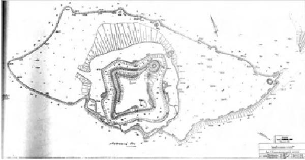
Рис. 2. План замчища «Замок Ракочі» (2001 р.)

новий замок у Меджибожі» [3, 45-46]. Під 1566 р. в Львівському літописі згадується про те, що велика орда оточила Меджибіж, де в замку сховалися