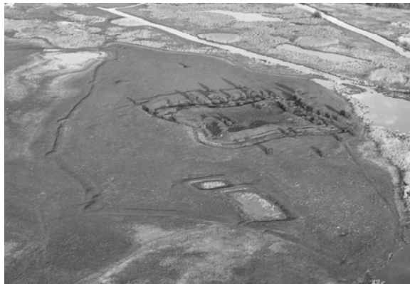
Рис. 3. На світлинні з повітря чітко читається «анвелоба»

контрастності в плані фортеці, що було зумовлено застосуванням артилерії в облозі та захисту фортець внаслідок винайдення димного пороху, котрий значно покращив властивості гармат. Декілька фортифікаційних шкіл намагалися пристосувати старі замки до нових умов та виробити нові підходи для будівництва укріплень. У 1527 р. в Нюрнберзі відомий живописець, рисувальник, гравер, математик, теоретик мистецтва і фортифікатор Альбрехт Дюрер (*21 травня 1471 — † 6 квітня 1528) написав трактат «Руководство по укреплению городов, замков и крепостей», в якому наводяться приклади побудови ідеального укріплення – як окремо фортеці, так і цілого міста [6]. Ідеї Дюрера були використані в Європі у Вероні, Нюрнберзі. Проте вели-