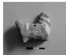
Мал. 3. Фрагменти глиняних виробів з заповнення посудної камери горна. Диканька, Полтавщина. Середина XVIII ст. (?).