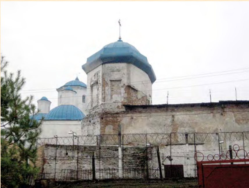
Північний фасад Харлампіївської церкви. Фото О. Лихвара, листопад 2010 року.

Харлампіївська церква, незважаючи на всі лихоліття історії, зберегла основні об'єми, наявні на її стінах сліди архітектурного декорування дозволяють відновити пам'ятку у формах, близьких до первісних. Храм потребує пильної уваги науковців та реставраторів, а також людей, небайдужих до своєї історії та культури.