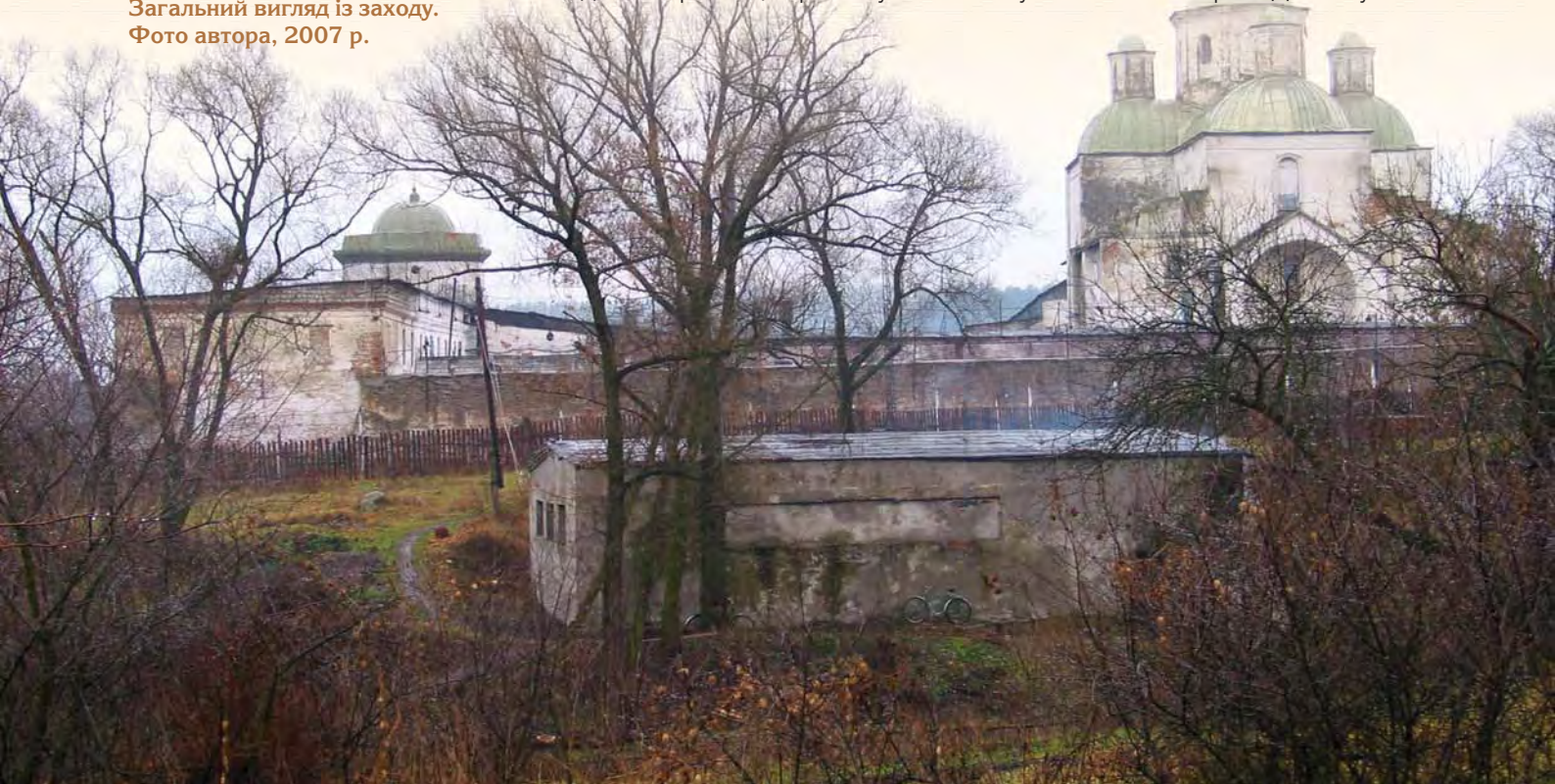
Гамаліївський монастир. Загальний вигляд із заходу. Фото автора, 2007 р.

1 грудня 1713 року Іван Скоропадський видає універсал на заснування монастиря. "Давно уже