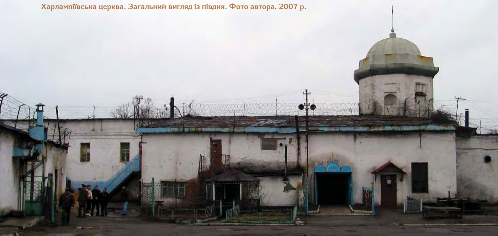
Харлампіївська церква. Загальний вигляд із півдня. Фото автора, 2007 р.

В другій половині ХІХ – на початку ХХ ст. в церкві було поховано відомих представників родини Скоропадських. Так, 1885 р. тут знайшов свій останній спочинок Петро Іванович Скоропадський – батько останнього гетьмана Павла Скоропадського. Він народився у 1834 році в с. Григорівці Конотопського повіту. За участь у походах на Кавказ був нагороджений низкою орденів. У 1864 р. відзначений орденом Св. Станіслава II класу та “золотою зброєю” з написом “за хоробрість”. Доклав багато зусиль для ліквідації кріпацтва. За це отримав 1861 р. медаль на Олександрійській стрічці. Діяльність свою розвивав, в основному, на Стародубщині. 1872 р. обраний почесним мешканцем Стародуба. Помер від перенапруги у Києві у 51-річному віці [31].