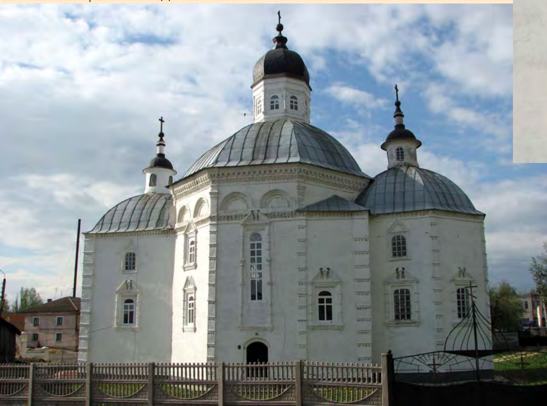
Облямування вікна собору Різдва Богородиці в Стародубі. Фото автора, 2008 р.