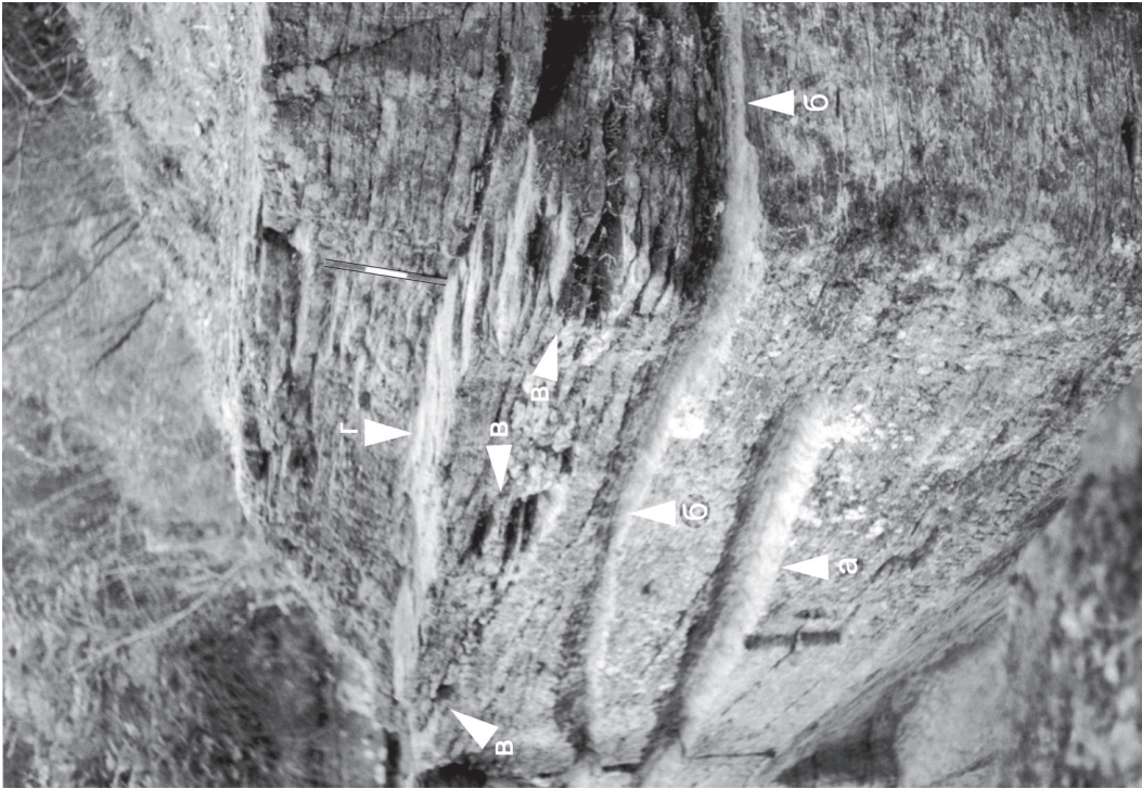
Іл. 3. Західна стінка приміщення № 1 (вигляд з північного боку) з чотирма різнорівневими системами кріплення перекриття: а – нижній жолоб; б – верхній жолоб; в – гнізда; г – вирубка-полиця.