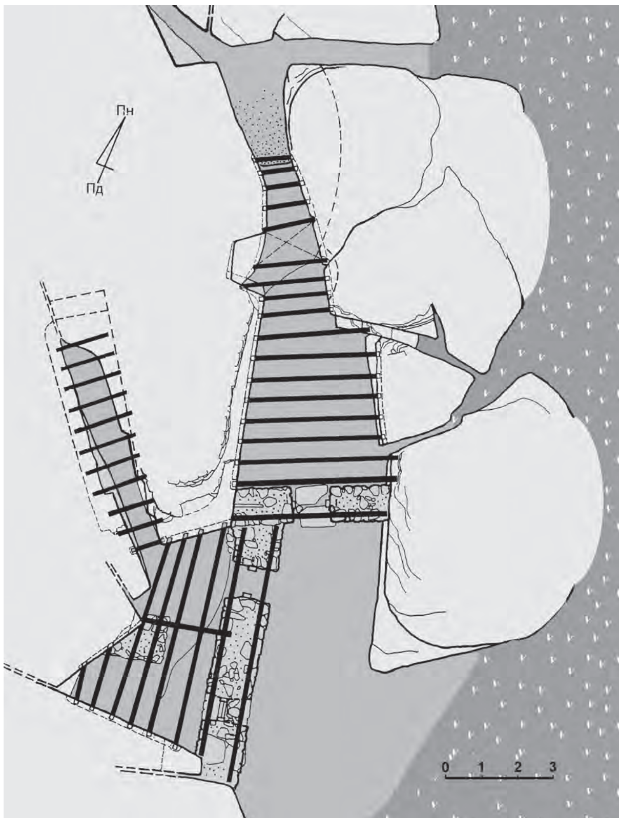
Іл. 8. Графічний план конструкцій перекриття кінця першої / початку другої чверті XIX ст. приміщень бушанського скельного комплексу. Рис. Ю. Диби, Р. Забашти