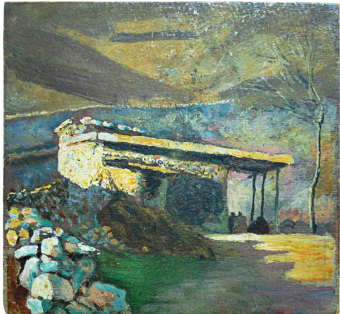
М. Мурашко. Сакля. 1900-і роки. Картон, олія. 21,2 см х 22,3 см