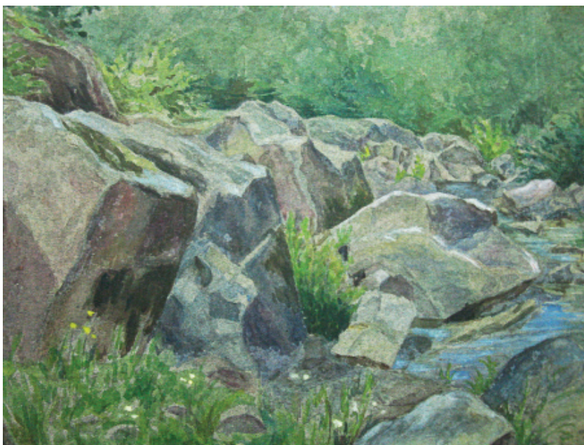
Г. Дядченко. Струмок серед каміння. 1890-і роки. Папір на картоні, олівець, акварель. 22,2 см х 30,8 см