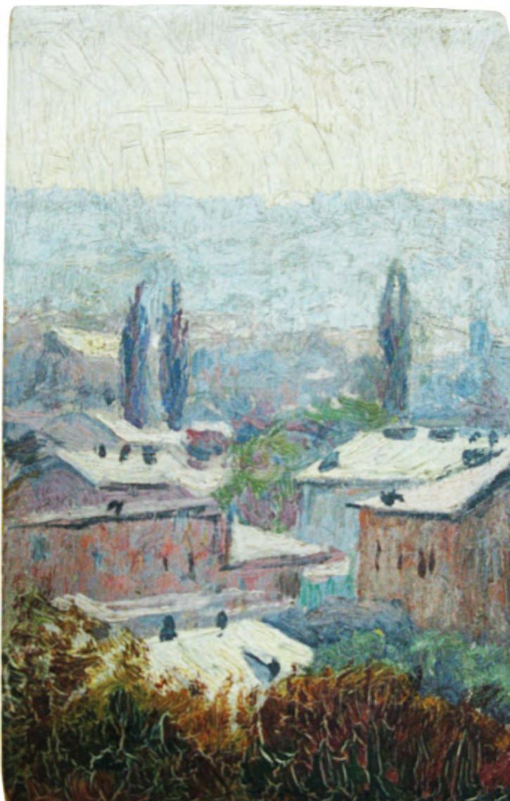
М. Мурашко. Крим. Вигляд міста. 1902. Дерево, олія. 9,8 см х 12,3 см