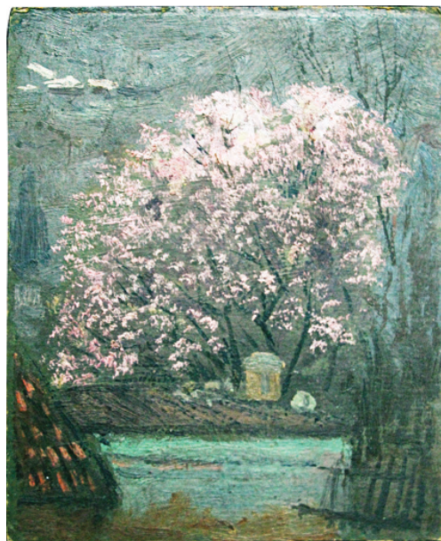
М. Мурашко. Квітуче дерево. 1902. Картон, олія. 18 см х 15,3 см