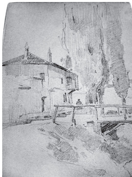
В. Андреев. Малюнки з альбому. 1894. Папір, олівець. 32,1 см x 23,5 см