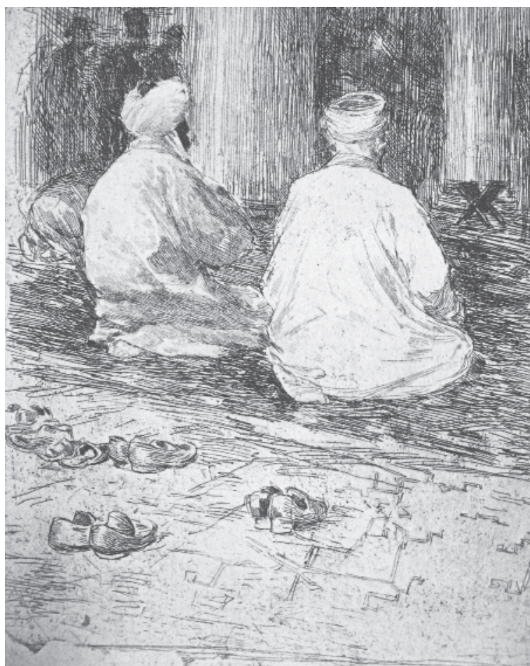
В. Андреев. У мечеті. Офорт. 23 см x 15,5 см; 31,5 см x 18,5 см