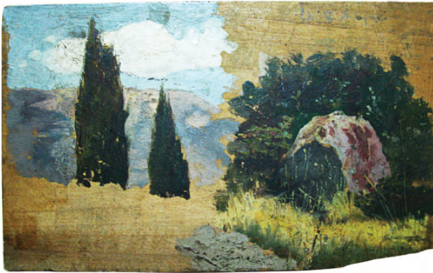
М. Мурашко. Крим. Алупка. 1893. Дерево, олія. 13,3 см х 22 см