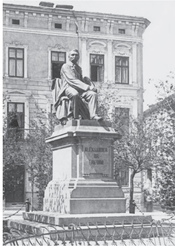
Іл. 7. Л. Марконі. Пам'ятник А. Фредро у Вроцлаві (перенесено зі Львова). 1897