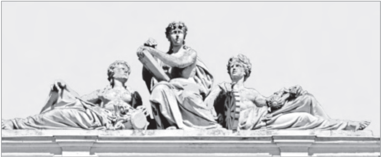
Іл. 1. Л. Марконі. Група «Інженерна наука, архітектура та механіка» на аттику головного будинку Львівської політехніки. 1876