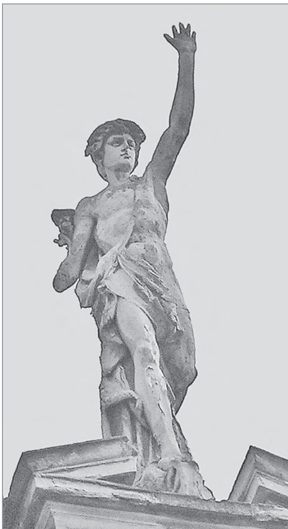
Іл. 3. Л. Марконі. Статуя Меркурія на аттику будинку по вул. Січових Стрільців, 3у Львові. 1887