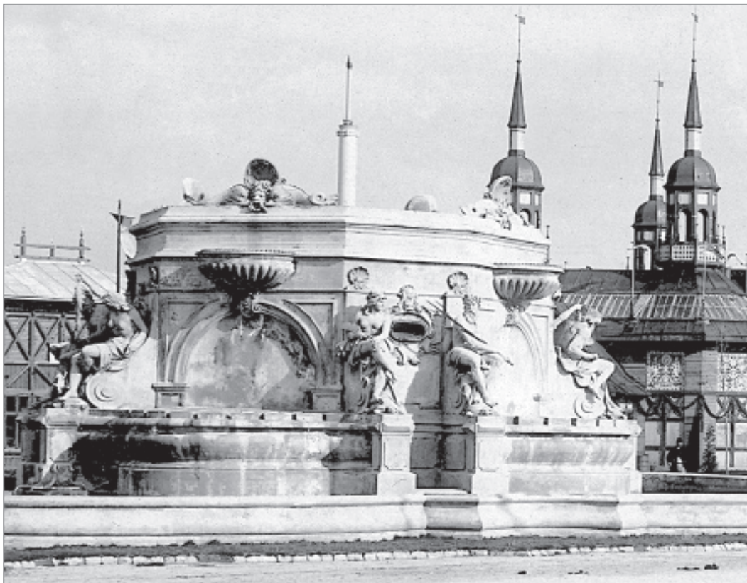
Іл. 8. Л. Марконі. Фонтан на Галицькій крайовій виставці у Львові. 1894