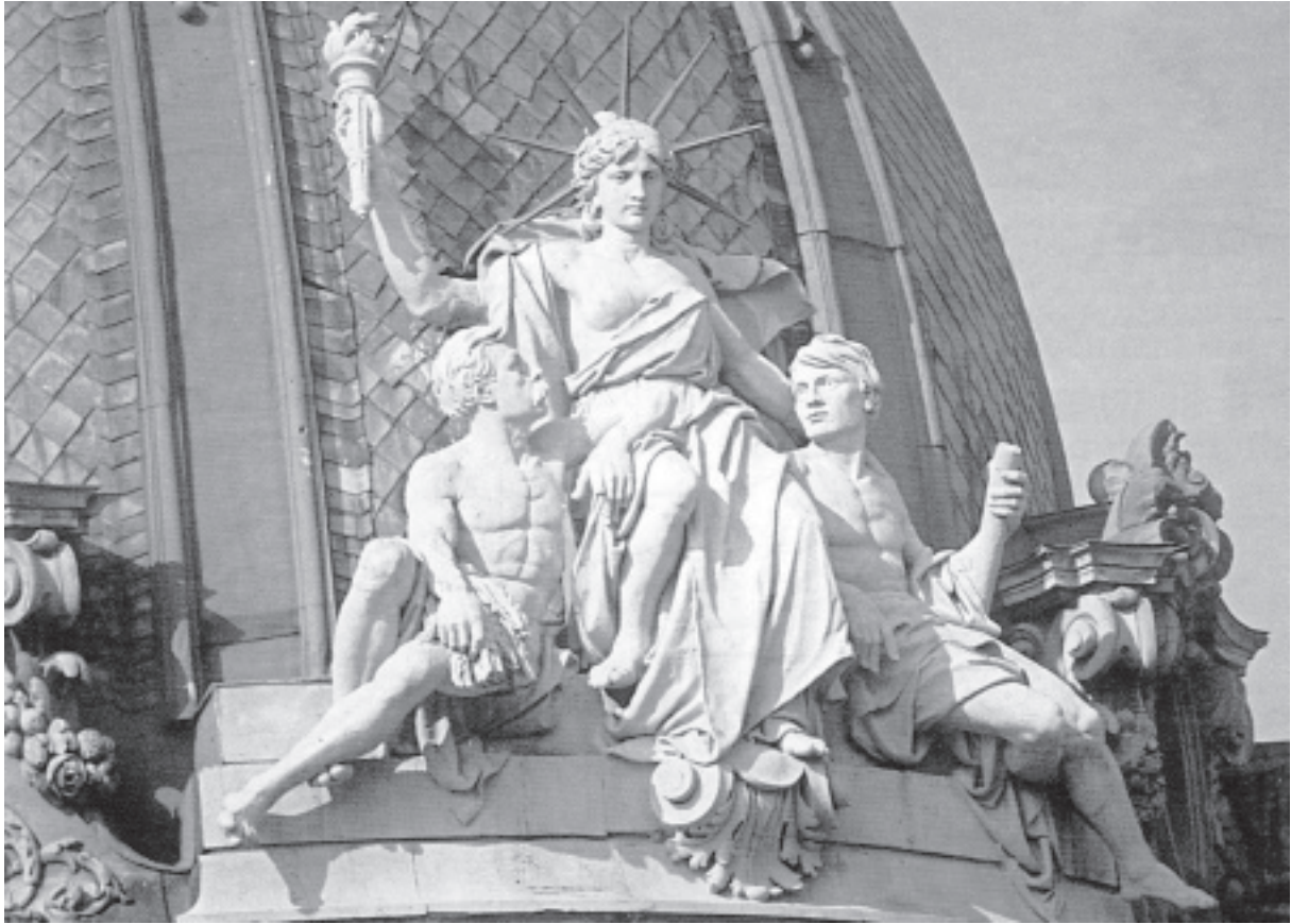
Іл. 5. Л. Марконі. Група «Ощадність, промисловість та рільництво» на аттиці Галицької ощадної каси у Львові. 1891