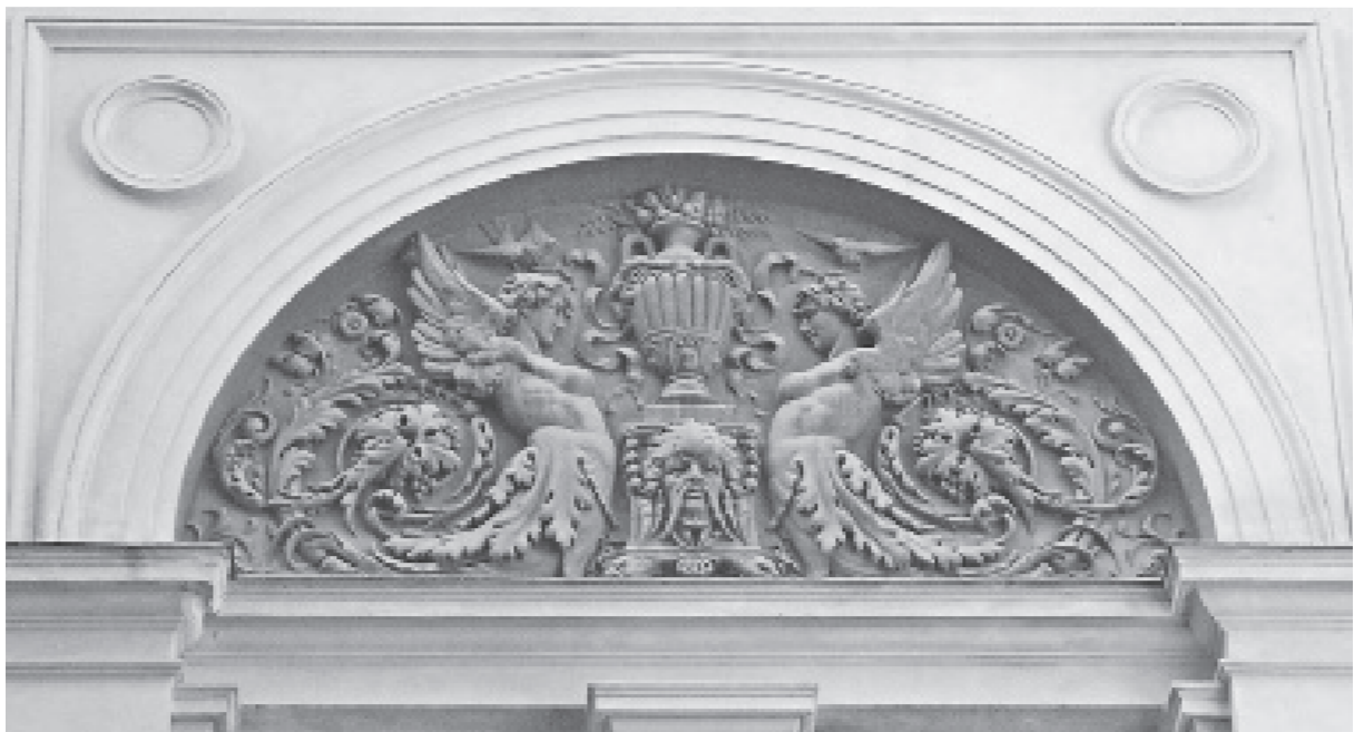
Іл. 2. Л. Марконі. Рельєф на зовнішній стіні зали засідань Галицького сейму. 1879