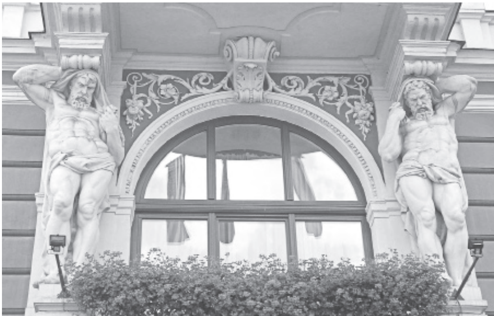
Іл. 6. Л. Марконі. Атланти на фасаді «Гранд-готелю» у Львові. 1893