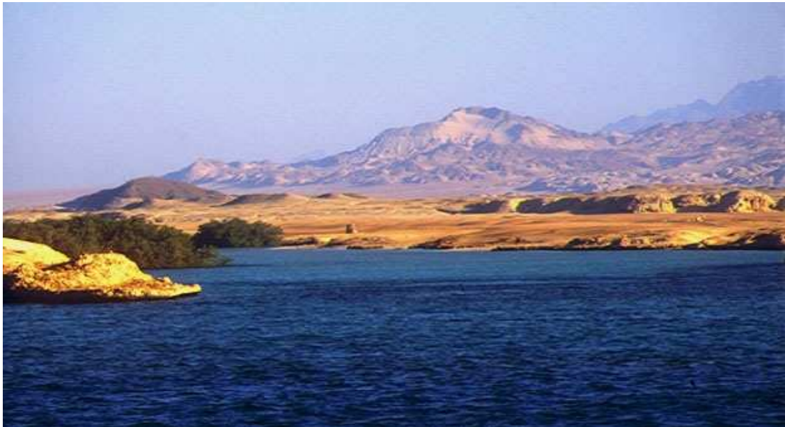
Синайские горы. Вид с моря.