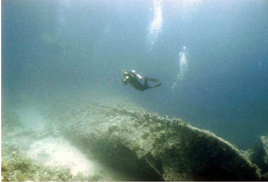
Рэк «Данравен». Носовая часть.