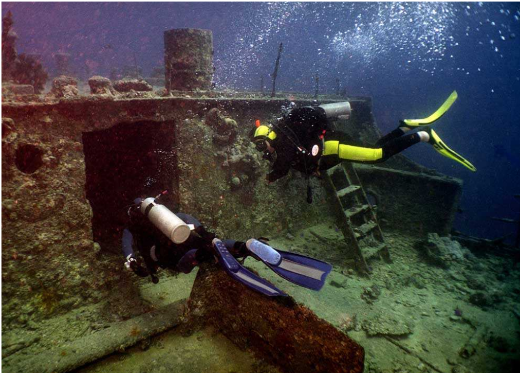
«Тистлегорм». Носовые каюты.

Уже с поверхности видно громаду военного транспорта. Осмотреть его полностью даже за два погружения сложно. Кроме того, передвижение аквалангистов замедлялось громоздким оборудованием для съемок. И только благодаря толковому гиду-инструктору, специализирующемуся на таких подводных экскурсиях, удалось охватить все максимально возможное. Начали с осмотра верхней палубы. Механизмы сильно обросли, но сохранились в первозданном виде. Мешали съемкам плотные стаи больших рыб, среди которых нахально толкались хищные тунцы. Свободней почувствовали себя в трюмах. Здесь время остановилось 70 лет назад.