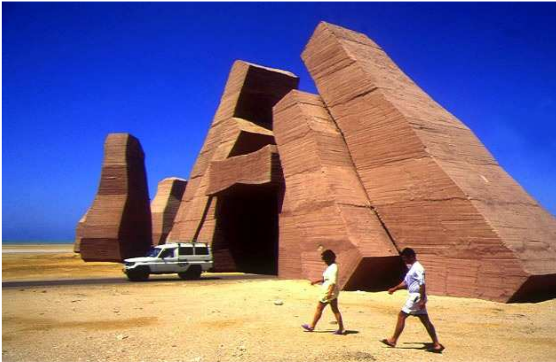
Синайский полуостров. Дорога в национальный парк Рас-Махаммед.

На автомашине утром сюда можно попасть раньше многочисленных подводных пловцов и просто туристов, передвигающихся на катерах. Барракуды, черепахи, тунцы, скаты и даже акулы практически не обращают внимания на еще редких в это время аквалангистов. Лучшие съемки нам удалось произвести именно здесь.