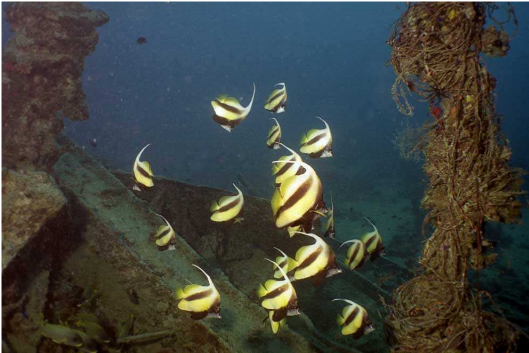
В обломках «Тистлегорма».

Подъем наверх осуществлялся с соблюдением всех правил декомпрессии. Большая глубина и длительное пребывание под водой могли вызвать кессонную болезнь. Все обошлось без эксцессов, и «Карина» легла на обратный курс.