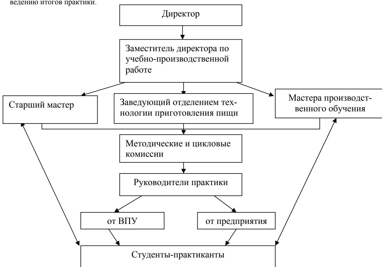
Рис. 1. Схема управления практической подготовкой в ВПУ

Для организации управления практическим обучением, по нашему мнению, необходим следующий комплекс документов: схема управления (рис. 1); должностные обязанности заместителя директора по учебно-производственной работе, старшего мастера, рекомендации руководителям практики от ВПУ и от предприятия; Положение о практике студентов; сквозные программы практики; Инструкции по контролю и подведению итогов практики.