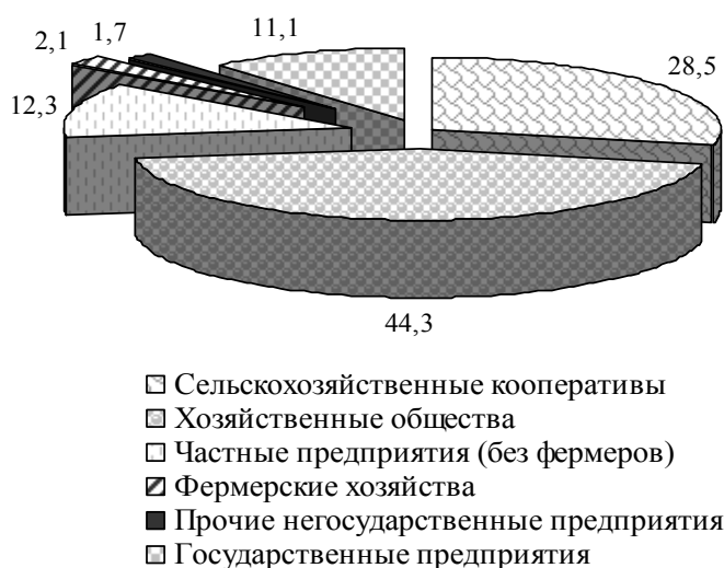
Рис.1. Структура крупных и средних аграрных предприятий по организационно-правовым формам хозяйствования в 2005г., %

ных предприятий, то к середине 2005г. насчитывалось уже 1062 предприятия, основным видом деятельности которых является сельскохозяйственное производство и предоставление услуг в растениеводстве и животноводстве. При этом 2005 году в Крыму осуществляли хозяйственную деятельность лишь 235 крупных и средних сельскохозяйственных предприятий, из которых 26 (11%) – государственные (в 1990г. их доля составляла 55%). Столь же существенно снизился вклад государственных предприятий в создание валовой продукции сельского хозяйства. До 1991г. госсектором производилось около половины продукции хозяйств всех категорий и трех пятых – сельскохозяйственных предприятий, а в 2005 году его доля составила соответственно 3,7 и 6,2 %. Негосударственными сельхозпредприятиями в 2005 году произведено 56% валовой продукции всех категорий хозяйств и 94% – сельхозпредприятий.