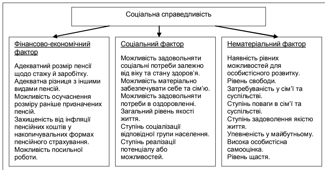
Рис. 2. Форми прояву "соціальної справедливості" через різні сфери суспільства.

пенсійного забезпечення виходить за межі формування в площині доходів та пенсійних активів, набуваючи нові форми. Характерною тенденцією розвитку категорії "соціальна справедливість" є її поширення й прояв через інші сфери суспільних відносин, що наведено на рис. 2.