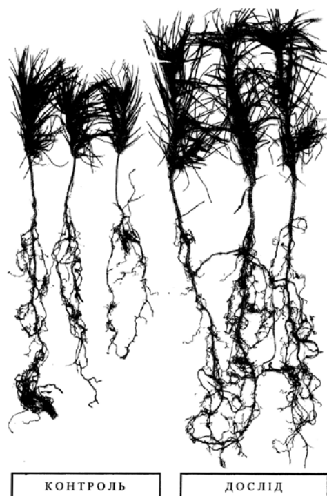
Рис. 1. Дослідні зразки однорічних сіянців сосни звичайної з лісорозсадника УНДІ лісового господарства і агломерації (с.м.т.Лютіж), 2005 рік

Перші захисно-декоративні лісостани у Київській області, створені за розробленою технологією, досягли 10-річного віку і, як показали дослідження, відзначаються біологічною стійкістю, високою екологічною ефективністю і продуктивністю (рис.1 та рис.2).