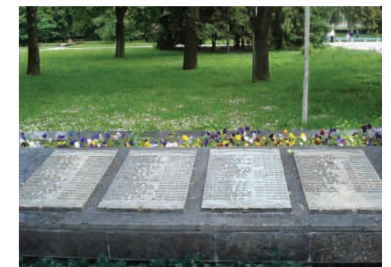
Плити з прізвищами партійних, радянських, комсомольських працівників, які загинули від рук українських націоналістів у 1944-1949 рр.

Неподалік – плити з прізвищами партійних, радянських, комсомольських працівників, які загинули від рук українських націоналістів у 1944–1949 рр.. Трохи далі – плити