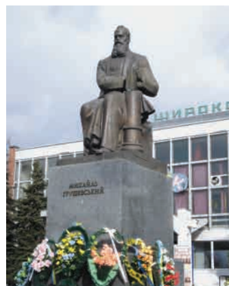
Пам'ятник М. С. Грушевському.

Крім цього у Старому місті (вул. Кафедральна) є цілий комплекс пам'ятних знаків, які свідчать про один із злочинів радянської влади у перші дні Великої Вітчизняної війни – розстріл кількох тисяч в'язнів Луцької в'язниці. На одній із пам'ятних плит – застережливий напис для нащадків: «Тим, хто прийде після нас. Ми полягли за Вашу Свободу. Бережіть її! 23 червня 1941». Неподалік, власне біля стіни колишньої в'язниці (нині тут монастир), – дерев'яний хрест, під яким є напис на плиті «Розстріляним в'язням Луцької тюрми 23–24 червня 1941 року». На стіні внутрішнього