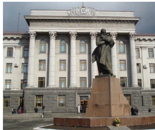
Пам'ятник Т. Шевченку (Скульптор – Едвард Кунцевич, архітектори – Олег Стукалов та Андрюш Бідзіля).

23 квітня 2000 р. біля Луцької міської ради відкрито пам'ятник покровителю міста Святому Миколаю (вул. Б. Хмельницького). Скульптор – Ярослав Скакун, архітектор – Андрюш Бідзіля 16 . 2000 р. на колишній площі Ринок у Старому місті біля Покровської церкви відкрито пам'ятний знак на честь двотисячоліття Різдва Христового. Скульптор – Микола Сівак 17 .