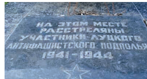
Пам'ятник жертвам Другої світової війни (вул. Драгоманова).

на пагорбі – символічний гранітний камінь із написом «Жертвам фашизму від громадян міста Луцька» 4 . Поруч нещодавно насипано дві символічні могили і встановлено дерев'яні хрести з написами. На одному – «Братська могила жертв другої світової війни (Кількість похованих не встановлено)», на іншому – «Братська могила жертв фашизму 1941–1942 рр. Тут перепоховано останки 370 військовослужбовців»