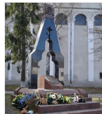
Пам'ятник загиблим (архітектор – Андрюш Бідзіля)

двору монастиря знаходиться цілий ряд пам'ятних дощок із прізвищами розстріляних в'язнів та назвами населених пунктів, де вони мешкали. Під ними – плита з написом «Пам'ять людська не забуде повік Братських могил стогін і крик. 23 червня 1996». У 2004 р. біля костелу Св. Петра і Павла на вшанування загиблих споруджено пам'ятник. Архітектор – Андрюш Бідзіля.