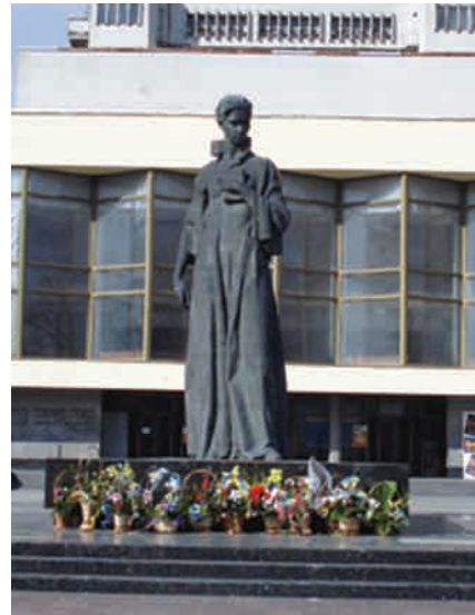
Пам'ятник Лесі Українці (скульптор Лев Муравін).

ім'я Лесі Українки. Один розташований у парку культури і відпочинку з 1966 р. (скульптор Лев Муравін, архітектор Ростислав Метельницький) 7 , другий – на Театральній площі