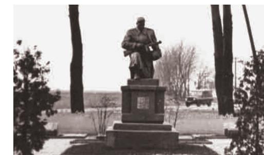
Братська могила жертв фашизму 1941–1942 рр..

на пагорбі – символічний гранітний камінь із написом «Жертвам фашизму від громадян міста Луцька» 4 . Поруч нещодавно насипано дві символічні могили і встановлено дерев'яні хрести з написами. На одному – «Братська могила жертв другої світової війни (Кількість похованих не встановлено)», на іншому – «Братська могила жертв фашизму 1941–1942 рр. Тут перепоховано останки 370 військовослужбовців»