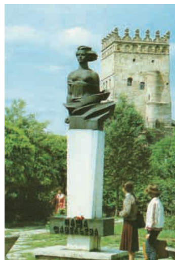
Пам'ятник Паші Савельєвій (скульптор В. Борисенко, архітектор В. Подольський).

(скульптор В. Борисенко, архітектор В. Подольський) – луцької підпільниці у роки Другої світової війни 3 , пам'ятник якій був нещодавно зруйнований, і символу праці робітників біля електроапаратного заводу.