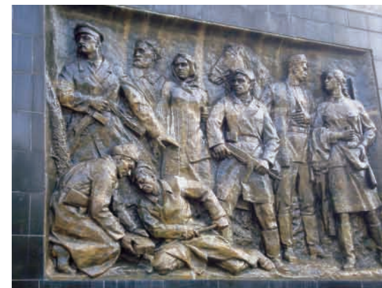
Меморіал вічної слави (скульптор М. Вронський, архітектор В. Грезділов, співавтори – Г. Бородін та Г. Годлевський).

Напроти Меморіалу зі сторони вулиці Шопена також є алея з іменами Героїв Радянського Союзу. Площу навколо обеліска