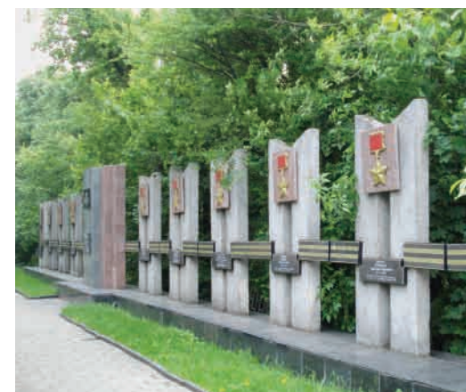
Алея Героїв Радянського Союзу.

Напроти Меморіалу зі сторони вулиці Шопена також є алея з іменами Героїв Радянського Союзу. Площу навколо обеліска