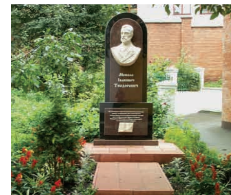
Пам'ятник М. І. Теодоровичу

У 2010 році на подвір'ї Покровської церкви встановлено пам'ятник Миколі Івановичу Теодоровичу, відомому церковному діячеві та досліднику Волині. Багато років тому дослідник волиніани М. Бойко із США у «Літописі Волині» писав: «Микола Теодорович у вільній Україні повинен бути по смерті нагороджений поясом пам'ятником за майже епохальну працю для добра Волині, яку він віддано любив, і в кількох місцях згаданій».