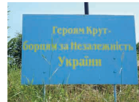
Пам'ятник Героям Крут.