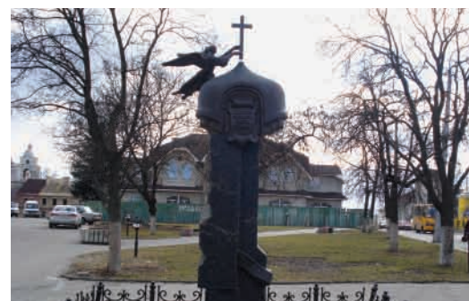
Пам'ятний знак на честь двотисячоліття Різдва Христового (скульптор – Микола Сівак).

22 серпня 2001 р. до 10-ї річниці незалежності України на Київському майдані відкрито пам'ятник «Борцям за волю і незалежність України» 18 . Згодом, 2 листопада 2001 р., на перетині проспектів Грушевського та Перемоги відкрито бронзовий пам'ятник Голові уряду УНР Михайлові Грушевському (1866–1934). Скульптор – Ярослав Скакун, архітектор – Андрюш Бідзіля 19 .