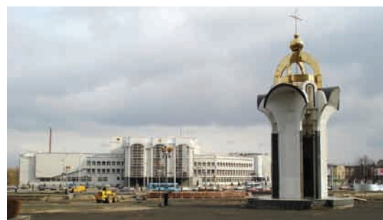
Пам'ятник борцям за волю і незалежність України.

22 серпня 2001 р. до 10-ї річниці незалежності України на Київському майдані відкрито пам'ятник «Борцям за волю і незалежність України» 18 . Згодом, 2 листопада 2001 р., на перетині проспектів Грушевського та Перемоги відкрито бронзовий пам'ятник Голові уряду УНР Михайлові Грушевському (1866–1934). Скульптор – Ярослав Скакун, архітектор – Андрюш Бідзіля 19 .