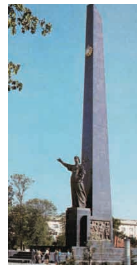
Меморіал вічної слави.

Найбільшим пам'ятко-архітектурним комплексом Луцька (7500 кв. м.) є Меморіал вічної слави, відкритий 29 жовтня 1977 р. 10 . Він поступово наповнюється новими пам'ятками історії краю. Авторами Меморіалу є народний художник УРСР, скульптор М. Вронський, архітектор В. Грезділов, співавторами – Г. Бородін та Г. Годлевський. У центрі комплексу – сорокаметровий обеліск із чорного граніту, який увінчує двометровий, покритий золотом орден Перемоги. Біля підніжжя обеліска – дев'ятиметрова бронзова скульптура жінки з лавровою гілкою у лівій руці. Перед нею горить вічний вогонь. На бічних гранях обеліска – вилиті з бронзи два горельєфи: визволителів Луцька і народних месників.