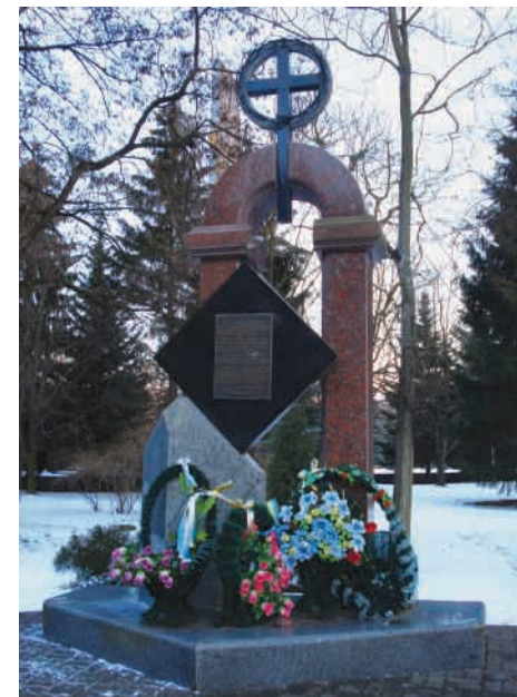
Пам'ятник українцям Холмщини, Підляшшя, Надсяння, Лемківщини, Бойківщини.

Напроти встановлено пам'ятник, відкритий 24 березня 2002 р. Ним вшановано трагічну долю українців Холмщини, Підляшшя, Над- сяння, Лемківщини, Бойківщини 12 .