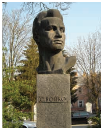
Пам'ятник Степану Бойку (скульптор А. Неверов).