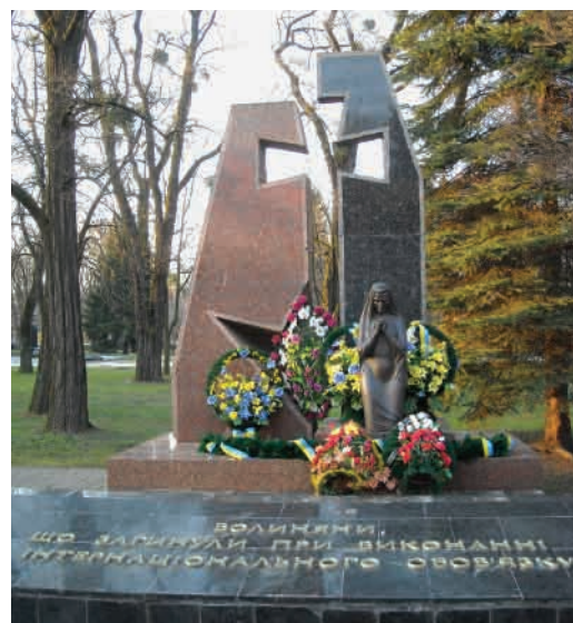
Пам'ятник загиблим воїнам-афганцям (скульптор – Олег Байдуков, архітектор – Андрош Бідзіля)

відкрито пам'ятник загиблим воїнам-афганцям. Центральними фігурами монумента є гранітна стела, проріз якої зображує хрест, а біля його підніжжя – посивіла мати, що оплакує героїв. Скульптор – Олег Байдуков, архітектор – Андрош Бідзіля 11 . Поруч –