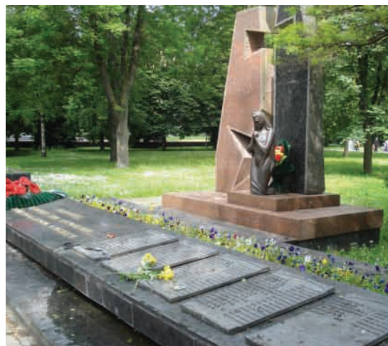
Плити з прізвищами волинян воїнів-інтернаціоналістів.

відкрито пам'ятник загиблим воїнам-афганцям. Центральними фігурами монумента є гранітна стела, проріз якої зображує хрест, а біля його підніжжя – посивіла мати, що оплакує героїв. Скульптор – Олег Байдуков, архітектор – Андрош Бідзіля 11 . Поруч –