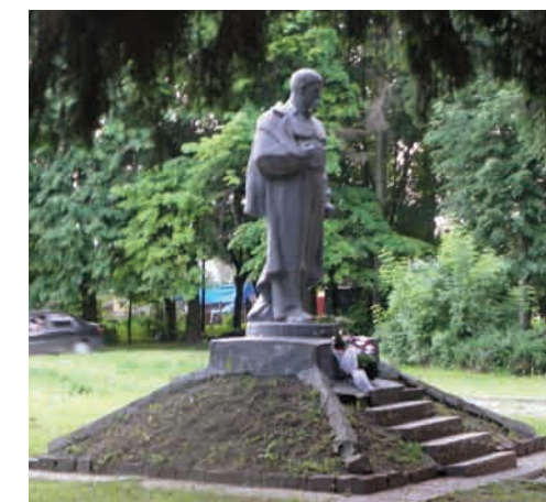
Пам'ятник Тарасові Шевченку.

були встановлені пам'ятний стовп (1944 р.) та пам'ятник із залізобетону (1986 р.). 5 Із 1964 р. у районі цукрового заводу стоїть пам'ятник Тарасові Шевченку – перший у Волинській області 6 . У трьох пам'ятниках прославлено