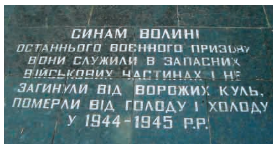
Плита в пам'ять волинян останнього воєнного призову.

У західній частині Меморіалу – стіна Скор- боти з назвами 107 спалених окупантами сіл, відомостями про загальні втрати населення області у війні, знищення військовополоне- них та горельєфом «Прокляття фашизму»