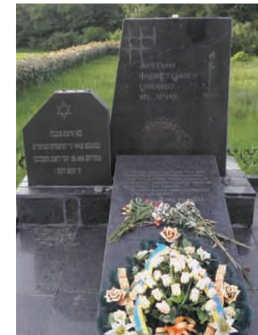
Пам'ятник жертвам фашизму від громадян міста Луцька.

У 1990 р. в районі цукрового заводу біля села Полонка створено меморіал жертвам геноциду і відкрито пам'ятник на триметровому насипному пагорбі. На плитах із лабрадориту, базальту та габро вибиті тексти українською мовою, ідиш та на івриті: «Жертвам фашистського геноциду від лучан», «На цьому місці в серпні 1942 року німецько-фашистськими загарбниками розстріляно 25658 громадян єврейської національності – жителів Луцька та околиць. Вічна Вам пам'ять». До 1990 р. на цьому місці були