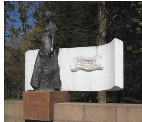
Пам'ятник Лесі Українці (скульптор Галина Кальченко).

Найбільшим пам'ятко-архітектурним комплексом Луцька (7500 кв. м.) є Меморіал вічної слави, відкритий 29 жовтня 1977 р. 10 . Він поступово наповнюється новими пам'ятками історії краю. Авторами Меморіалу є народний художник УРСР, скульптор М. Вронський, архітектор В. Грезділов, співавторами – Г. Бородін та Г. Годлевський. У центрі комплексу – сорокаметровий обеліск із чорного граніту, який увінчує двометровий, покритий золотом орден Перемоги. Біля підніжжя обеліска – дев'ятиметрова бронзова скульптура жінки з лавровою гілкою у лівій руці. Перед нею горить вічний вогонь. На бічних гранях обеліска – вилиті з бронзи два горельєфи: визволителів Луцька і народних месників.