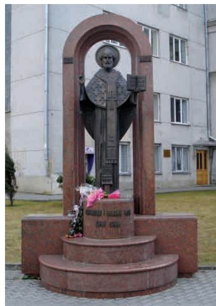
Пам'ятник Святому Миколаю (Скульптор – Ярослав Скакун, архітектор – Андрюш Бідзіля).

23 квітня 2000 р. біля Луцької міської ради відкрито пам'ятник покровителю міста Святому Миколаю (вул. Б. Хмельницького). Скульптор – Ярослав Скакун, архітектор – Андрюш Бідзіля 16 . 2000 р. на колишній площі Ринок у Старому місті біля Покровської церкви відкрито пам'ятний знак на честь двотисячоліття Різдва Христового. Скульптор – Микола Сівак 17 .