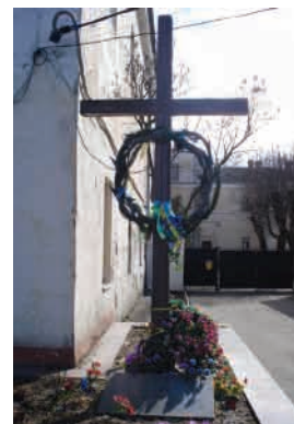
Хрест і плита у пам'ять загиблих в'язнів Луцької в'язниці.

Крім цього у Старому місті (вул. Кафедральна) є цілий комплекс пам'ятних знаків, які свідчать про один із злочинів радянської влади у перші дні Великої Вітчизняної війни – розстріл кількох тисяч в'язнів Луцької в'язниці. На одній із пам'ятних плит – застережливий напис для нащадків: «Тим, хто прийде після нас. Ми полягли за Вашу Свободу. Бережіть її! 23 червня 1941». Неподалік, власне біля стіни колишньої в'язниці (нині тут монастир), – дерев'яний хрест, під яким є напис на плиті «Розстріляним в'язням Луцької тюрми 23–24 червня 1941 року». На стіні внутрішнього