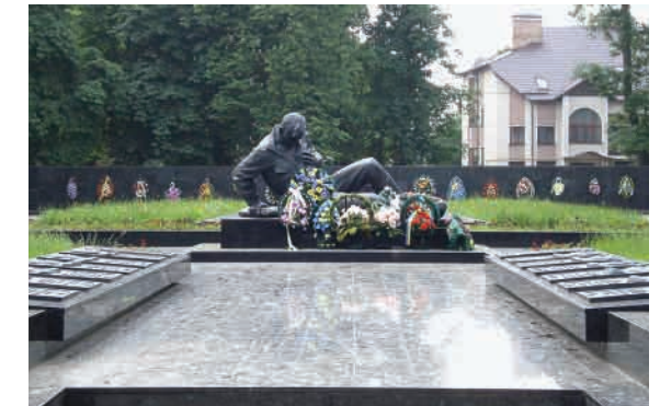
Центральна братська могила.

апсида з чорного граніту з викладеними на ній назвами фронтів, армій, корпусів, дивізій, прикордонних загонів та застав, партизанських з'єднань і загонів, які брали участь у захисті та визволенні області. Від центрального обеліска алея веде до центральної братської могили, де на бронзових плитах вилито прізвища понад 1800 воїнів, які загинули в боях за визволення міста. На плитах – барельєфи Героїв Радянського Союзу. В центрі братської могили – скульптура смертельно пораненого воїна з автоматом у правій руці.