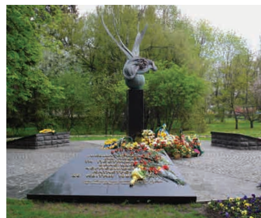
Пам'ятник ліквідаторам аварії на ЧАЕС

22 серпня 2008 р. на Меморіалі відкрито пам'ятник ліквідаторам аварії на ЧАЕС та по- страждалим внаслідок Чорнобильської ката- строфи 26 квітня 1986 року. Скульптор – Ва- силь Гурмак 13 .