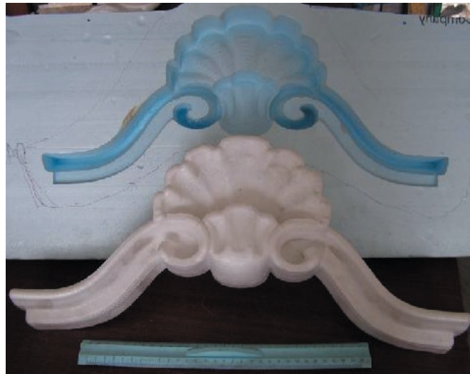
Рис. 3. Модели художественной отливки и пресс-формы

Из пенополистироловой модели пресс-формы по ЛГМ-процессу часто отливают алюминиевую пресс-форму, а затем, если необходимо, доводят ее до требуемой чистоты поверхности на том же станке с ЧПУ. Это упрощает всю технологию перевода