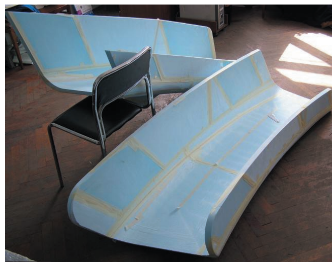
Рис. 4. Модели отливок желоба

По принципу действия система ЧПУ с серводвигателем является системой с обратной связью, сигнал позиции подается от оптического датчика (инкодера), который закреплен на двигателе и снабжает контролер информацией о реальном повороте вала двигателя. Эта информация используется для постоянной коррекции отклонений между величиной заданного и реального перемещения режущего инструмента. Для получения объемной копии с детали без чертежа в этих станках используется сканирование с цифровой записью информации. Управление станком осуществляется через USB-порт с обычного персонального компьютера в среде