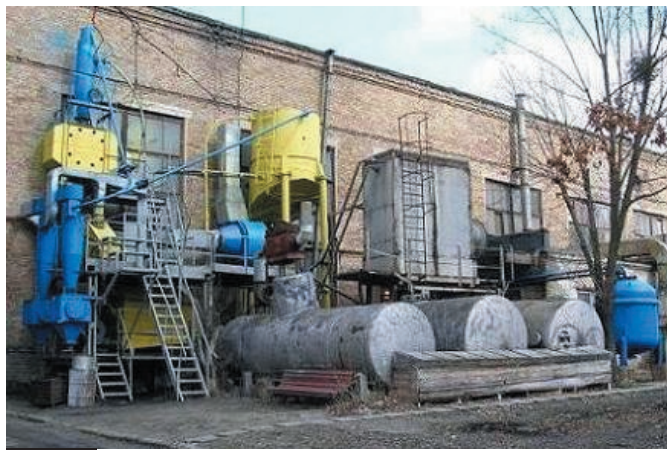
Рис. 1. Комплекс оборудования пескооборота в цехе ФТИМС

является решающим фактором. Этим параметрам вполне соответствует технология ЛГМ, что подтверждает мировая практика постоянного роста производства отливок этим способом, которое уже достигает 1,5 млн. т/год. В одной КНР работает до 1 тыс. таких участков при активном использовании этой технологии в авто- и двигателестроении.