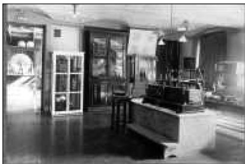
Вимірювальний зал електротехнічної лабораторії ХТІ