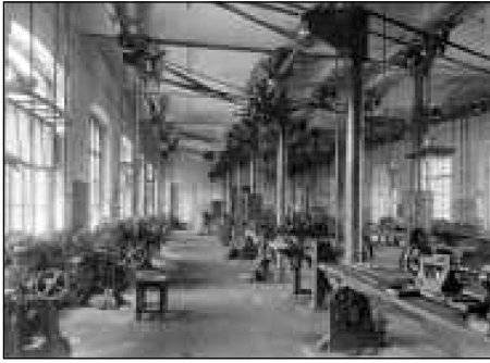
Механічна лабораторія з випробування матеріалів