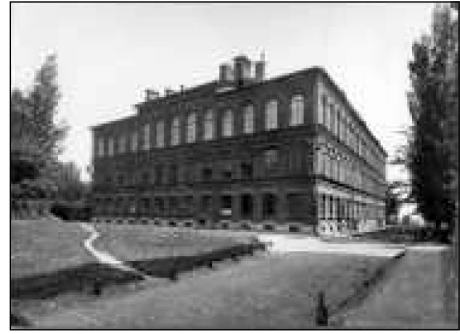
Хімічний корпус ХТІ

діяльності В. Л. Кирпичова. Однією з причин такого стану є те, що вчений умів безпомилково залучати до викладацької та науково-дослідної роботи кадри.