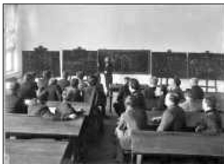
Лекція професора П.М. Мухачова з прикладної механіки

Про здібності і ерудицію В. Л. Кирпичова, широту його наукового кругозору свідчить методика підготовки і викладання ним студентам спеціальних технічних дисциплін з використанням матеріалів інших галузей знань. Більше всього, починаючи зі студентських років, його цікавили математика і механіка. Але він глибоко був знайомий і з природничими науками, чудово знав астрономію і ботаніку. Своїми знаннями з ботаніки він викликав подив крупних спеціалістів-ботаніків [3, с.18].