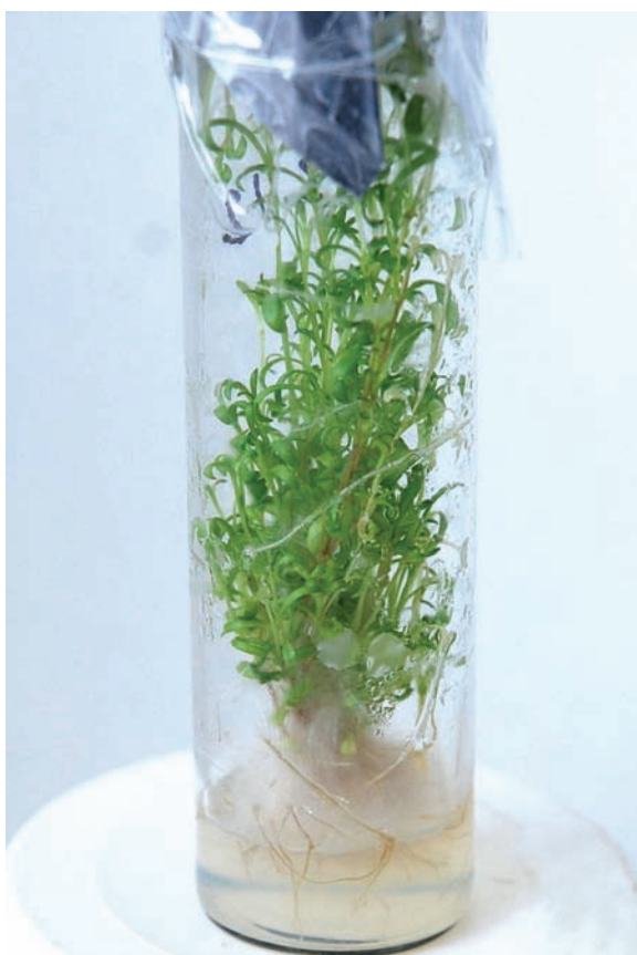
Рис. 2. Ризогенез у D. gratianopolitanus

Завершальним і досить відповідальним етапом при культивуванні рослин in vitro є адаптація до умов ex vitro , яка можлива лише тоді, коли рослина здатна проявити стійкість та пристосувати свою життєдіяльність до нових умов існування. На даній стадії розвитку, при перенесенні рослин-регенерантів у нестерильні умови, вони потребують ретельного догляду і регульованих умов культивування [5]. Тому виникає необхідність створити такі умови адаптації рослин до умов ex vitro , при яких можна отримати найвищий відсоток приживлення. Одержані рослини-регенеранти D. gratianopolitanus перенесли до адаптаційної кімнати, висаджували у торф'яні таблетки та розміщували у спеціальні контейнери з регульованими умовами росту. Постійними підтримували температуру, вологість