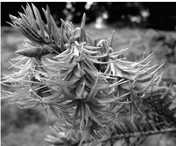
Рис. 2. Макростробілярна шишка псевдотсуги Мензиса

через +7^{\circ}\text{C} розпочинаються процеси формування макростробіла та відбувається процес макроспорогенезу. Наприкінці квітня — на початку травня макростробіли набувають жовто-зеленого, пурпурово-фіолетового або бордового забарвлення, покривні луски шкірясті і мають гострі тризубчаті, мечоподібні, дугоподібно відігнуті закінчення, що значно виступають за краї заокруглених насінних лусок (рис. 2).