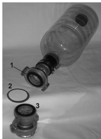
Рис. 2. Эксплуатация устройства: 1 – через горловину заливается отмеренный объем пробы; 2 – мембранный фильтр помещается на сетку и вкладывается между фланцами держателя; 3 – ответная часть фланца держателя фильтра

Для концентрирования фитопланктона нужен необходимый объем пробы заливать в банку через разомкнутый фланец держателя фильтра (рис. 2). Затем, в положении вверх горловиной, на фланец поместить мембранный фильтр с опорной сеткой-подкладкой, накрыть ответным фланцем и стянуть поворотом замка на 1/4 оборота. Образуется плотное соединение, исключающее протекание фильтруемой воды. Приспособление устанавливается горловиной вниз, к вентилю в дне банки подсоединяется насос и нагнетается воздух (рис. 3). Можно использовать любой велосипедный или автомобильный насос.