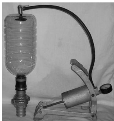
Рис. 3. Готовность устройства к работе

Вес устройства в комплекте с автомобильным насосом не превышает 1,5 кг. При транспортировке, для компактности, полиэтиленовую банку можно смять. Затем при работе надуть и расправить. Полиэтиленовая банка достаточно устойчива к механическому износу, а при необходимости ее легко заменить новой.