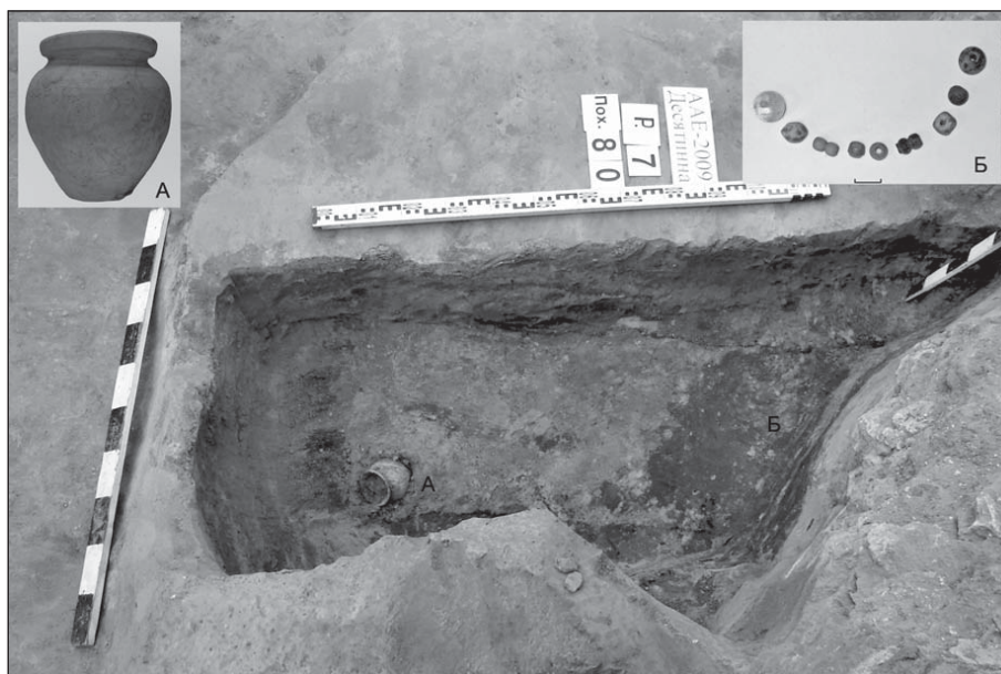
Рис. 2. Поховання 80: А — горщик; Б — намистини

ними зрізана під основу зрубної конструкції на внутрішньому схилі нового рову. Тоді, схоже, був вибраний весь зовнішній схил першого рову, від якого залишилася тільки придонна частина і заповнення над нею.