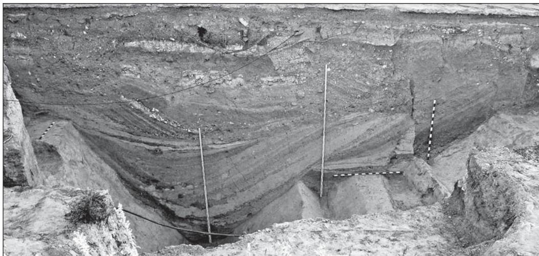
Рис. 3. Перетин рову Старокиївського городища

Це місце поряд із храмом виявилось практично єдиним, не зачепленим розкопками XIX—XX ст. та об'єктами ранішого часу, крім згаданих поховань. У прошарку ремонту виявлені уламки фресок, а шар часу будівництва храму представлений щебенем зі сколів вапняку, який суцільною площею вкривав давню поверхню.