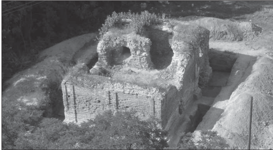
Рис. 1. Любеч, кам'яниця П. Полуботка. Вигляд з південного сходу