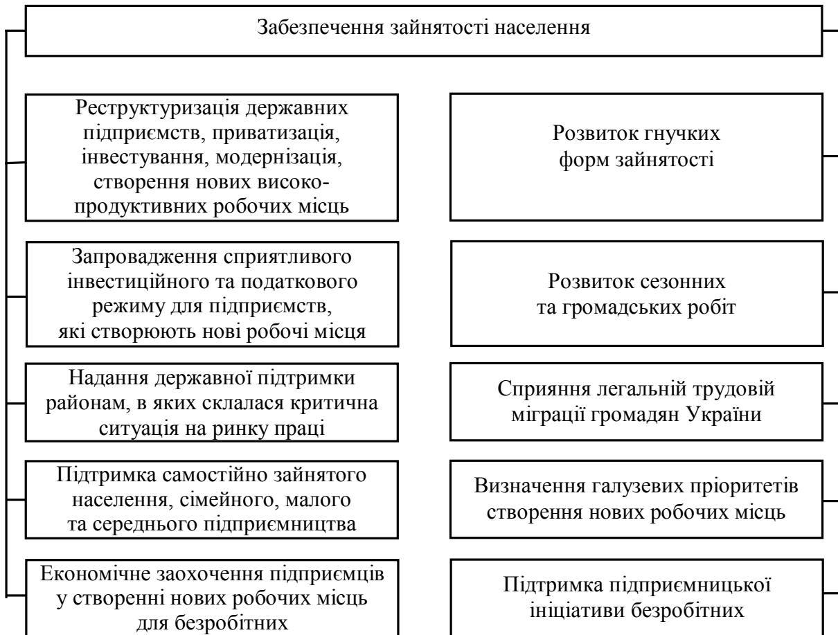
Рис. 1. Заходи забезпечення зайнятості населення

диктувалися економічним станом країни. Наприклад, як головне джерело інвестицій для створення робочих місць планувалося використовувати власні кошти підприємств, а вони в цей період були обмеженими.