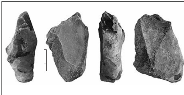
Рис. 2. Маслово 5в, завадовские отложения (OIS 9—11). Кремневое изделие

Кремневые артефакты обнаружены на нескольких уровнях в витачевских, удайских и прилукских отложениях. Один из горизонтов в низах прилукских отложений, кроме артефактов, содержал фрагменты костей животных и раковины Helix . Каменные коллекции количественно невелики и недостаточны для полноценной характеристики индустрий. Вместе с тем, имеющиеся в коллекции артефакты (преимущественно сколы и единичные орудия) не противоречат среднепалеолитической принадлежности материалов из прилукского и удайского горизонтов и их предполагаемому абсолютному возрасту между, примерно, 70—100 и 60—70 тыс. лет назад соответственно. Материалы из витачевских отложений технико-типологически достаточно разнородны (имеются скребла, скребковидные формы) и не могут быть однозначно отнесены ни к среднему, ни к верхнему палеолиту. Не исключено наличие здесь самостоятельных средне- и верхнепалеолитических культурных горизонтов.