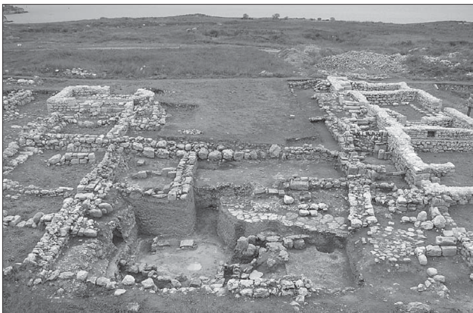
Рис. 2. Херсонес Таврический. Общий вид квартала LX с юго-востока

и 14а существовал вход шириной 0,8 м. В юго-восточной стене помещения 14 находился вход шириной 1,1 м, через который можно было пройти со двора внутрь. С юго-западной стороны от входа внутри помещения 14 находилась каменная конструкция, сооруженная из плоских известняковых плит, функционировавшая в качестве печи (0,3 × 0,5 × 0,3 м). Помещение 14/14а относится ко второму строительному периоду.