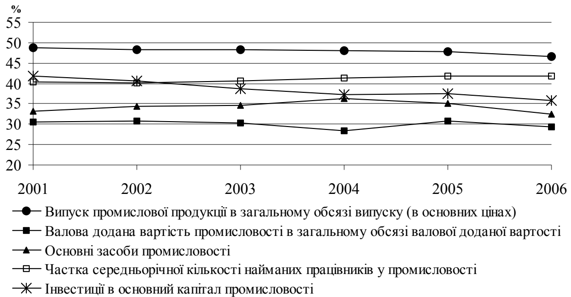
Рис. 1. Промисловість в економіці України