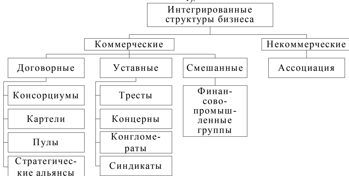
Рис. 1. Классификация интегрированных структур бизнеса, действующих в мировой практике

Результаты. На основании проведенного автором исследования мировой практики хозяйствования предлагается следующая классификационная схема интегрированных структур бизнеса (рис. 1).