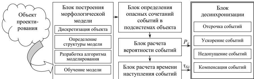
Рис. 3. Структурная схема САПР «КАТАSTOP»

САПР состоит из блока построения морфологической модели объекта проектирования, блоков работы с моделью: определения опасных сочетаний событий в объекте, расчетов вероятности и времени их наступления. В случае выявления информации о реальной угрозе таких сочетаний в работу включается блок десинхронизации, который предлагает проектные решения для «разведения» опасных событий во времени (десинхронизация), а также, по возможности, меры по их недопущению или своевременной компенсации.