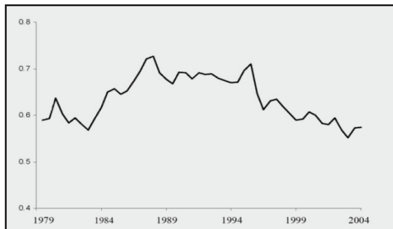
Показник індексу згуртованості для ЄП як єдиного цілого (1979-2004)

У ЄП політичний процес відбувається в рамках двовимірної шкали. Першим виміром є традиційна для європейських країн шкала ліво-правої орієнтації, де конкуренція відбувається навколо соціоекономічних питань. Другий вимір полягає в протистоянні прихильників та противників подальшої інтеграції [5, с.495].