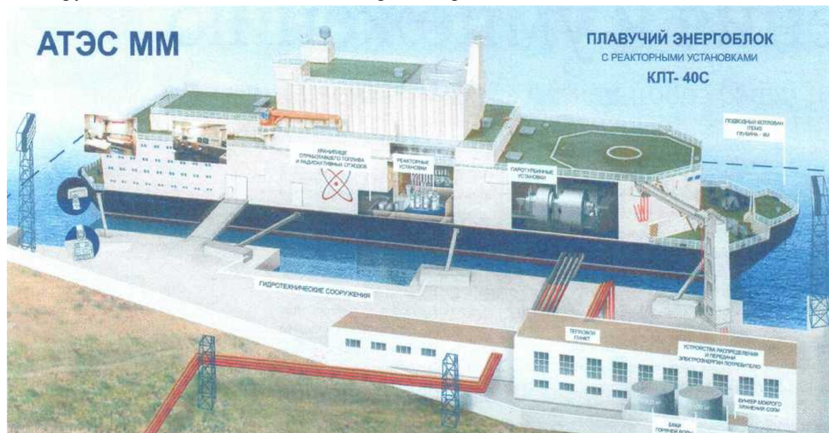
Рис. 1. Атомная теплоэлектростанция малой мощности на базе плавучего энергоблока

разработке месторождений нефти и газа на полуострове Ямал, на шельфе арктичес-