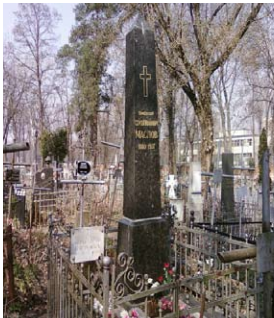
Сучасний вигляд могили С. Маслова на Лук'янівському цвинтарі в м. Києві*.

Ради Міністрів України, написаному у зв'язку із вшануванням пам'яті С. Маслова у 1957 р., наголошувалось: “Він був видатним спеціалістом з історії давньої російської та української літератури. Ні в Україні, ні в усьому Радянському Союзі й поза його межами не було вченого, рівного С. І. Маслову щодо знання фактів і історико-літературного процесу давньої літератури. Він був ученим виняткової ерудиції в галузі бібліографії, книгознавства, палеографії, критики тексту, історії мови та літератури, суспільно-політичної й культурної історії нашої країни” 27 .