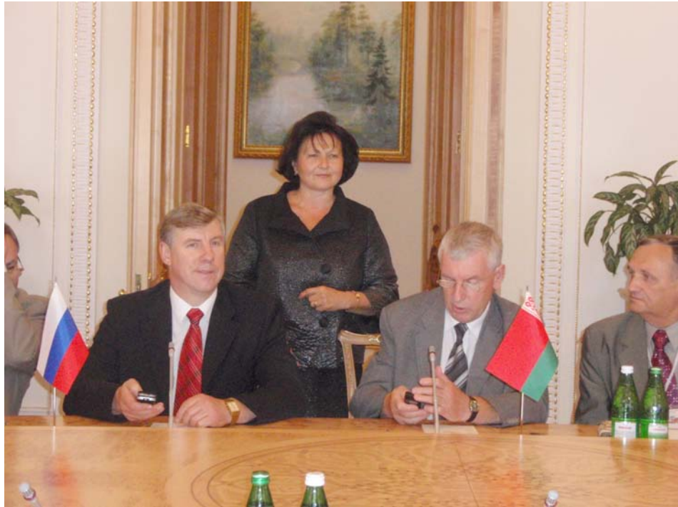
Очільники архівних служб України, Росії, Білорусі під час прийому у Голови Верховної Ради України В. М. Литвина. 10 вересня 2009 р.

є державними службовцями, і на утримання позаштатних працівників. Так, Держархів м. Севастополя утримує за рахунок додатково 11,5 посади, держархіви Рівненської області – 9, Хмельницької області – 2. Центральні державні архіви також передбачають використання до 25 % від суми надходжень на оплату праці співробітників – недержавних службовців.