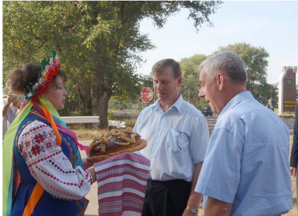
Зустріч учасників тристоронньої зустрічі на кордоні Чернігівської області 11 вересня 2009 р.

фонду. З 2008 року архів почав переклад МКФ актових книг на цифрові носії на сканері мікроформ Мінольта 7000.