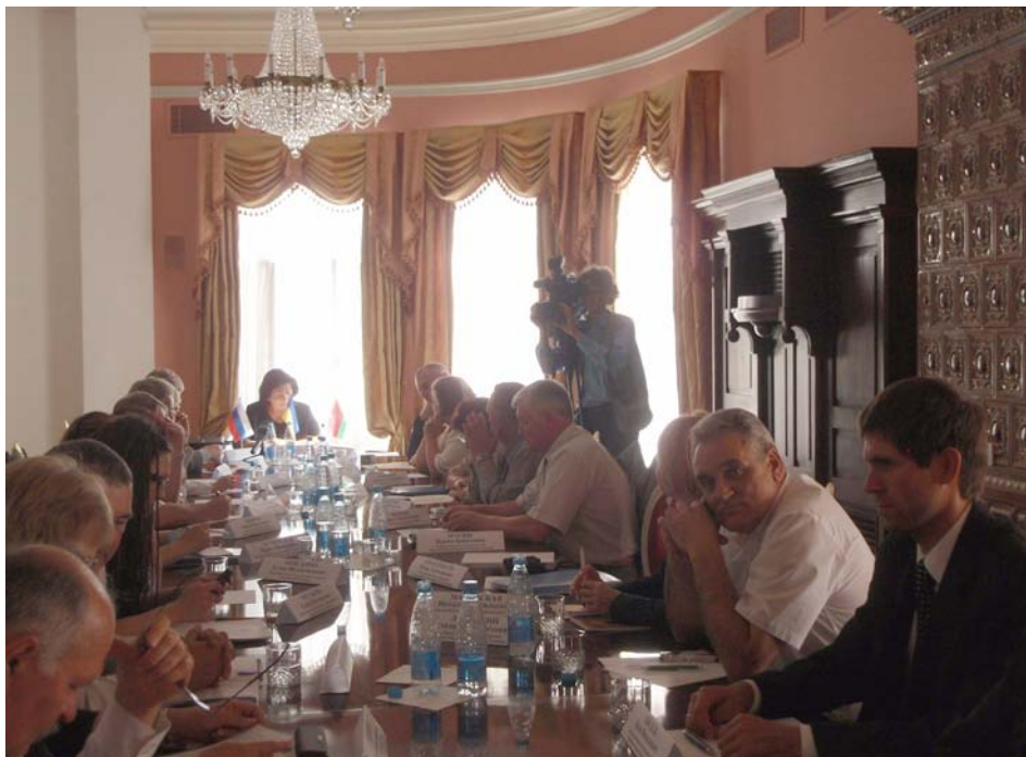
Перше робоче засідання (“Митрополичі палати” Національного заповідника “Софія Київська”). 10 вересня 2009 р.

Можна прогнозувати, що і надалі ці види послуг залишаться у числі найбільш затребуваної споживачами архівної інформації. Інші види платних послуг, такі як добірка, систематизація документів для використання в радіо- і телепередачах, створенні витворів науки, літератури і мистецтва, надання послуг з використання кінофотофонодокументів, підготовка на запити користувачів виставок документів, проведення лекцій, уроків, екскурсій по архівах, власне кажучи, завжди були лише потенційним джерелом надходження позабюджетних коштів.