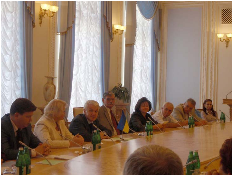
Тематична зустріч з Головою Верховної Ради України В. М. Литвиним. 10 вересня 2009 р.

Адміністраціями низки суб'єктів Російської Федерації намічені антикризові заходи й розроблені відповідні програми, плани, у тому числі із забезпечення належної діяльності архівних установ в умовах оптимізації бюджетних витрат. Суть цих заходів – проведення антикризової фінансової політики, що забезпечує виконання програми розвитку архівної справи на основі зосередження витрат на пріоритетних напрямках архівної роботи й дотримання суворого режиму економії. Для цього повинні бути підвищені ефективність використання бюджетних коштів і управлінських рішень, організаційний рівень роботи, перерозподілені (якщо виникне в цьому потреба) посадові обов'язки, підвищена ефективність праці, збережена соціальна й психологічна стабільність у колективах.