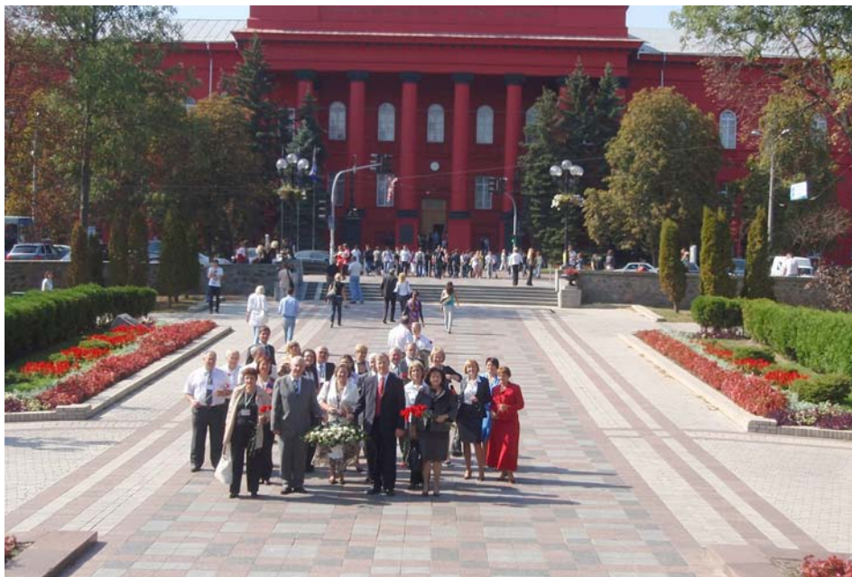
Покладання квітів до пам'ятника Т. Г. Шевченка. 10 вересня 2009 р.

На федеральному рівні з певною часткою обережного оптимізму можна стверджувати про окремі позитивні тенденції. Зокрема, фіксується деяке поліпшення кадрової ситуації у федеральних архівах, робочі місця в архівах стали більш затребуваними. У докризовий період укомплектованість кадрами федеральних архівів становила 67 %. Тепер вакансії, хоча й повільно, але поступово заповнюються.