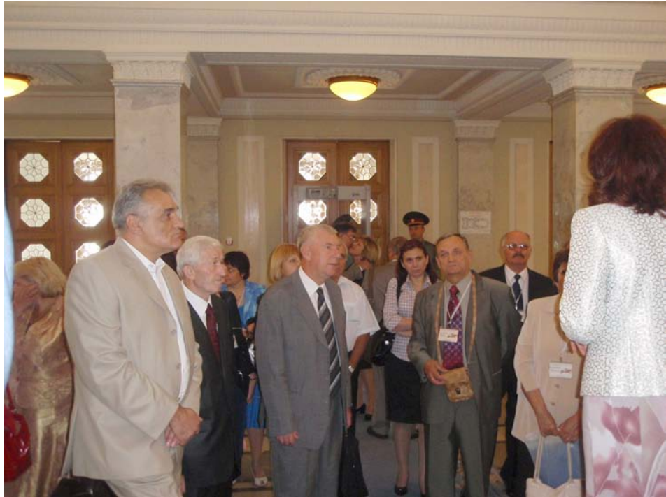
Відвідання учасниками тристоронньої зустрічі Верховної Ради України 10 вересня 2009 р.

Протягом звітного періоду надані кошти були успішно освоєні: побудовано 8 поверхів (з 15-ти) нового корпусу Центрального державного історичного архіву, 4 поверхи корпусу для розміщення створеного архіву закордонної українки й науково-дослідного інституту, розпочато будівництво 3-поверхового корпусу для сучасних читальних залів центральних архівів.