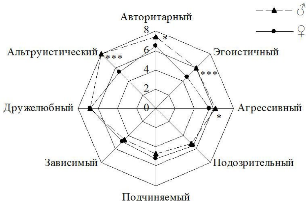
Рис. 3. Профили, отражающие представление о структуре межличностных отношений респондентов мужской и женской групп.