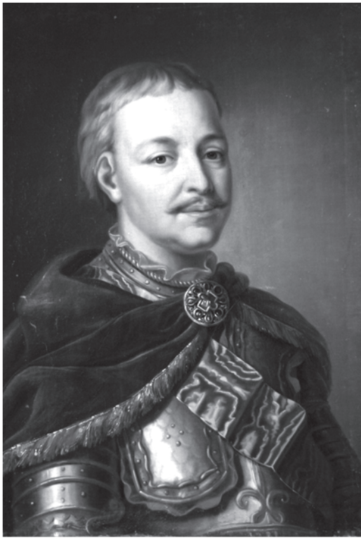
Невідомий художник. Портрет Івана Мазепи в латах та з "андріївською" стрічкою Дніпропетровський художній Музей

Відомо, що І.Мазепа став кавалером ордена Андрія Первозванного у 1700 р. 5 У січні того року Петро I викликав його до Москви. Гетьманське посольство у складі 48 осіб прибуло до російської столиці 22 січня і залишалось у ній до 25 лютого. 8 лютого цар вручив гетьману грамоту на орден святого апостола Андрія Первозванного 6 . Першим таку нагороду у 1699р. отримав граф Федір Головкін. Як свідчать документи, орден гетьман отримав лише у серпні, про що свідчить