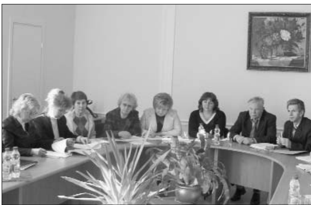
Засідання Науково-технічної ради

ріально-технічне забезпечення роботи фахівців Інституту, забезпечення комп'ютерними програмами та автоматизованими системами, патентно-інформаційними базами, виробничими площами тощо. Окремий блок питань складають підготовка, перепідготовка та підвищення кваліфікації фахівців. Засідання проводяться регулярно.