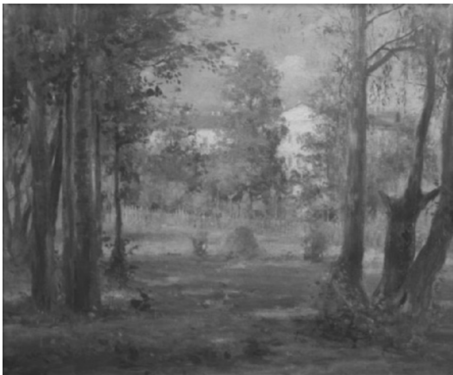
Картини С.Ф. Шиска з “ніжинської” тематики: “Ніжинський педінститут” (1940 р., полотно, олія) та “Парк біля інституту” (полотно, олія). Обидві були подаровані художником Ніжинському державному педагогічному інституту імені М.В. Гоголя (сучасний державний університет), у Картинній галереї котрого вони нині й експонуються (до статті О. Пономар (стор. 95–97))