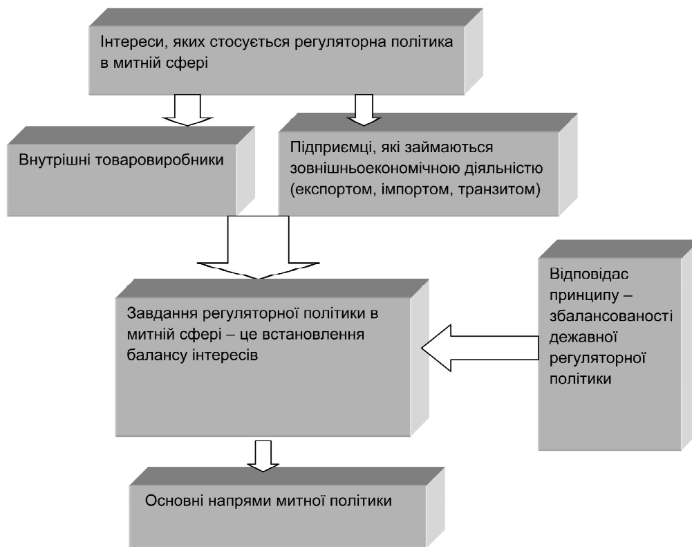
Рис 1. Вплив регуляторної політики на формування концептуальних положень митної політики

торної політики у сфері господарської діяльності» міститься таке визначення регуляторної політики, як напряду державної політики, спрямованого на вдосконалення правового регулювання господарських відносин, а також адміністративних відносин між регуляторними органами та суб'єктами господарювання, недопущення прийняття економічно недоцільних та неефективних регуляторних актів, зменшення втручання держави у діяльність суб'єктів господарювання та усунення перешкод для розвитку господарської діяльності, що здійснюється в межах, порядку та таким чином, який встановлюється Конституцією та законами України.