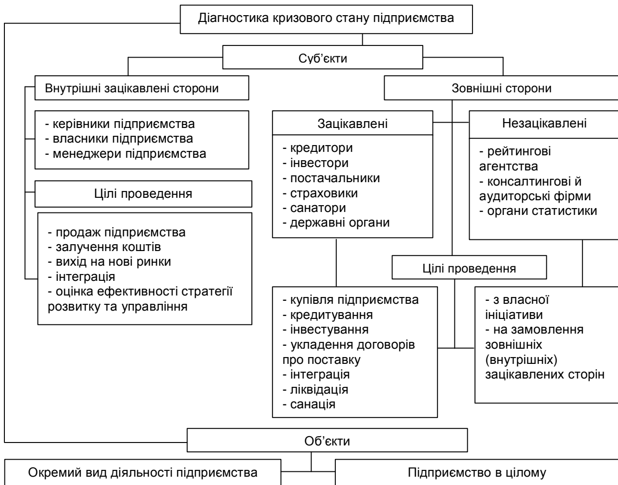
Рис. 1. Суб'єкти, об'єкти та цілі діагностики кризового стану підприємств.

є для їх керівників та власників, адже її результати - основне джерело повної та достовірної інформації про реальний стан та можливості підприємства і, відповідно, основа для прийняття ефективних рішень щодо подальшої стратегії його розвитку. Важливою вона також є і для окремих органів державної влади, інвесторів, кредиторів, страховиків, конкурентів, клієнтів тощо. Її результати дозволяють зазначеним сторонам уникнути зайвого ризику від партнерства з досліджуваним об'єктом та забезпечити стабільність і збалансованість національної економіки. Відповідно до цього суб'єктами діагностики кризового стану підприємств можуть бути внутрішні зацікавлені сторони та зовнішні зацікавлені (незацікавлені) сторони. Перелік можливих суб'єктів, об'єктів та цілей діагностики наведений на рисунку 1.