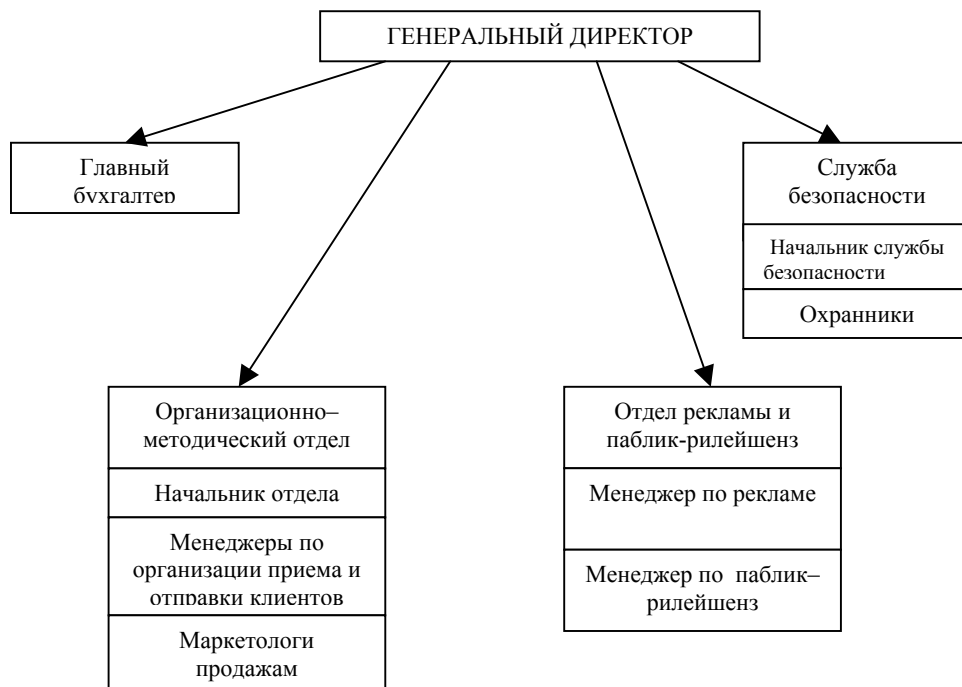
Рис.2. Предлагаемая структура турфирмы винного туризма.

Для реализации идеи необходим начальный капитал для регистрации фирмы, приобретения оборудования и оплаты труда персонала на первоначальный период работы в сумме 266 тыс. грн. Для начала работы требуется аренда офисного помещения, оборудование, фонд оплаты труда и т.п., поэтому планируется привлечение кредита сроком на I год в размере 200 тыс. грн. под 30 % годовых.