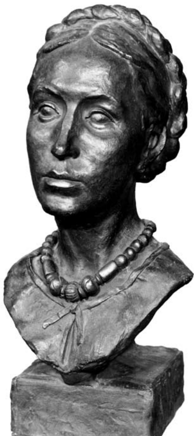
Скульптурне відтворення образу жінки черняхівської культури (антропологічна реконструкція Г. Лебединської)

В останніх століттях I тис. до н. е. в ареалі венедев — Надвісленні — сформувалася пшеворська археологічна культура. Нові культури склалися в цей час і трохи пізніше й на теренах України — зарубинецька (кінець III ст. до н. е. — I ст. н. е.), ареал якої охоплював Середнє Подніпров'я та Прип'ятське Полісся; київська (кінець II — середина V ст.), пам'ятки