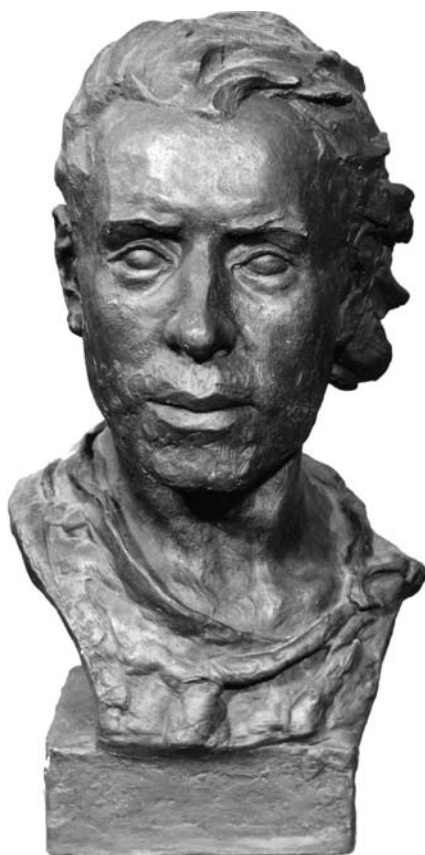
Скульптурне відтворення образу чоловіка черняхівської культури (антропологічна реконструкція Г. Лебединської)

Серед українських фахівців переважає думка про праслов'янський характер білогрудівської та чорноліської археологічних культур передскіфського періоду (лісостепові й порубіжні з ними залісені райони Правобережжя, Поділля та Східна Волинь) і скіфів-орачів лісостепової смуги Середньої Наддніпрянщини 14 . Польські та деякі російські вчені акцентують свою увагу на праслов'янському характері лужицької і генетично пов'язаної з нею пшеворської культур 15 . Наголошується, що в Сілезії та Малопольщі існували тісні контак-