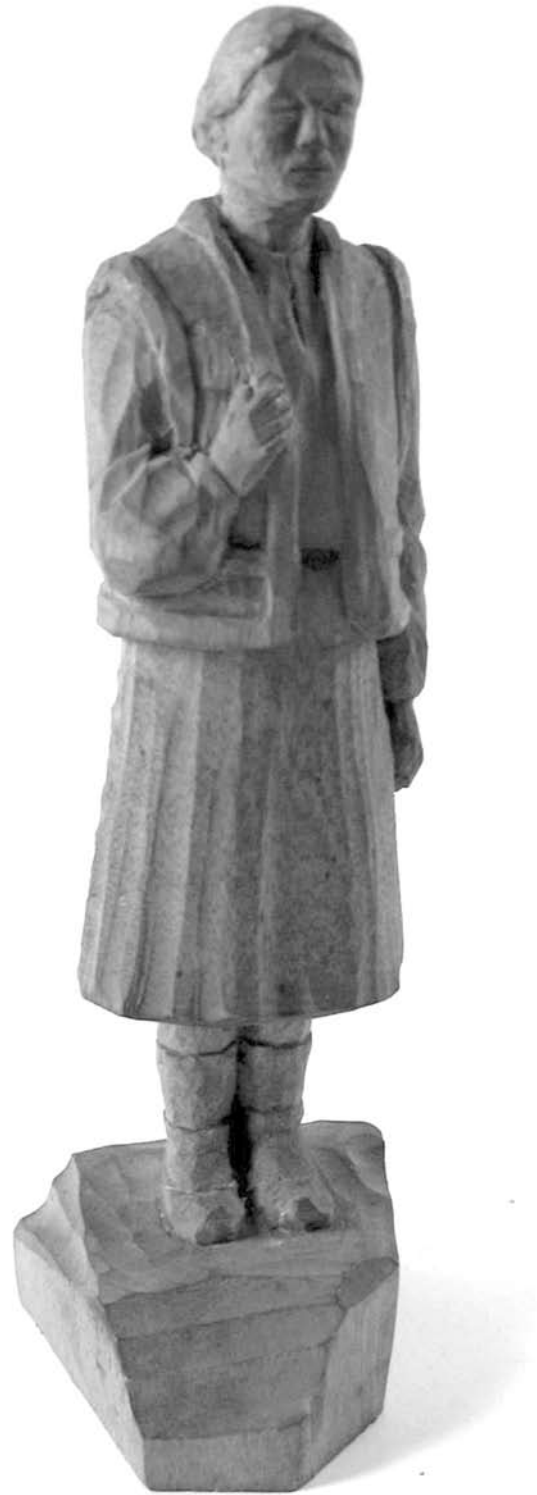
Іл. 2. М. Грєпіняк. Дівчина-гуцулка. 1956 р. Дерево липи. Об'ємне різьблення. Інв. № 14758. 4,5 x 15,5. Коломийський музей народного мистецтва Гуцульщини та Покуття (КМНМГП)

Цілковито зрозумілим є звернення М. Грєпіняка до тематичних зображень, оскільки повноту життя справді важко передати лише за допомогою геометризованих узорів, якими б досконалыми, світлими і пісєнними вони не були. В історії Гуцульської плоскої різьби лю-