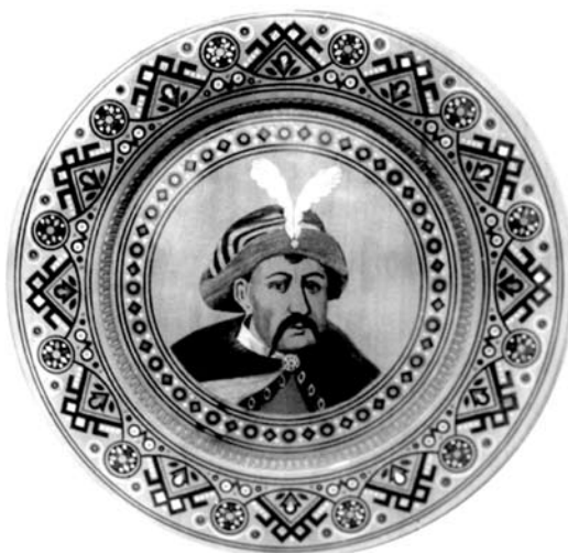
Іл. 5. М. Грепиняк. Портрет Б. Хмельницького

кість допоміжних ліній, які відділяють портрет від орнаменту, зменшується, сприяючи більшій взаємодії фриза із центральним сюжетом (іл. 6). Незмінними залишаються лише те шанобливе ставлення та любов, із якою майстер звертається до образу Кобзаря не лише у сюжетно-тематичній різьбі, а й у дереворитах та малюнках.