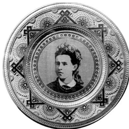
Іл. 4. М. Грепиняк. Портрет Л. Українки

Неодноразово митець виконував портрети Тараса Шевченка. Проте, кожного разу автор обдумує цей образ заново, шукаючи нові шляхи вирішення композиції. Якщо в ранніх творах обрамлення все ще досить масивне, із підкресленням його декоративного ефекту, то з часом кіль-