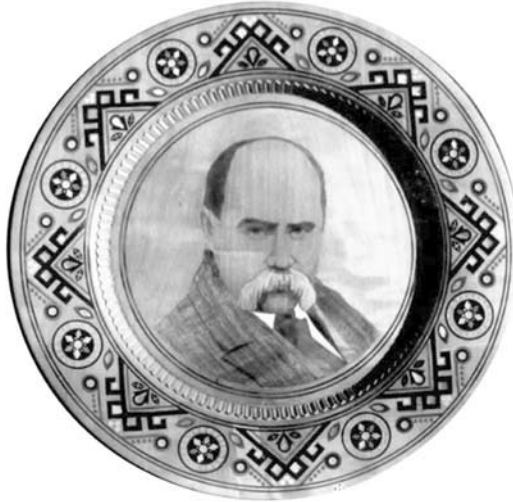
Ил. 6. М. Грепняк. Портрет Т. Шевченка. 1989 р. Дерево груші, інкрустація