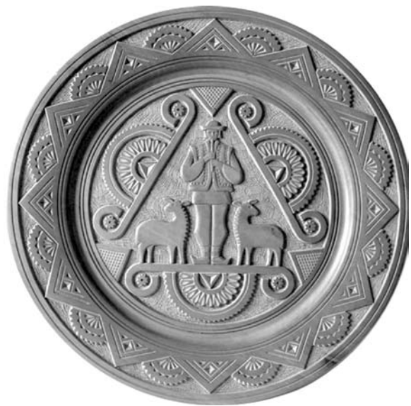
Іл. 3. М. Грепіняк. Тарілка (Гуцул із вівцями). 1971 р. Дерево груші. Точіння, різьблення, рельєфне різьблення. Інв. № 78. Діам. — 29,5. Музей Косівського державного інституту прикладного та декоративного мистецтва (КДПДМ)

Зацікавлення викликають і ті композиції, сюжетна складова яких вписана у прямокутник та розміщується, переважно, на декоративних скриньках. Відповідно до народних традицій, центральну частину відмежовано від обрамлення, у якому майстер, як і в інших своїх виробках, використовує орнамент із надзвичайно різноманітних елементів, ускладнюючи та доповнюючи його інкрустацією з намистин, перламутру та кольорового дерева. Проте, ці композиції більш статичні, митець особливо звертає увагу на текстуру матеріалу, активно використовує її як декоративний елемент. Збе-