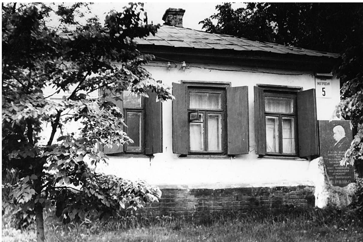
Хата на Пріорці (до реставрації)

У люстрації Київського воєводства зафіксована скарга жителів Пріорки на монахів домініканського монастиря у зв'язку із заборною користуватися лісами та пасовищами. У другій половині XVII ст., після визвольних змагань під проводом Богдана Хмельницького, частина земель, що належала католикам, була передана Київському братському монастирю, і таким чином Сирець, Куренівка та