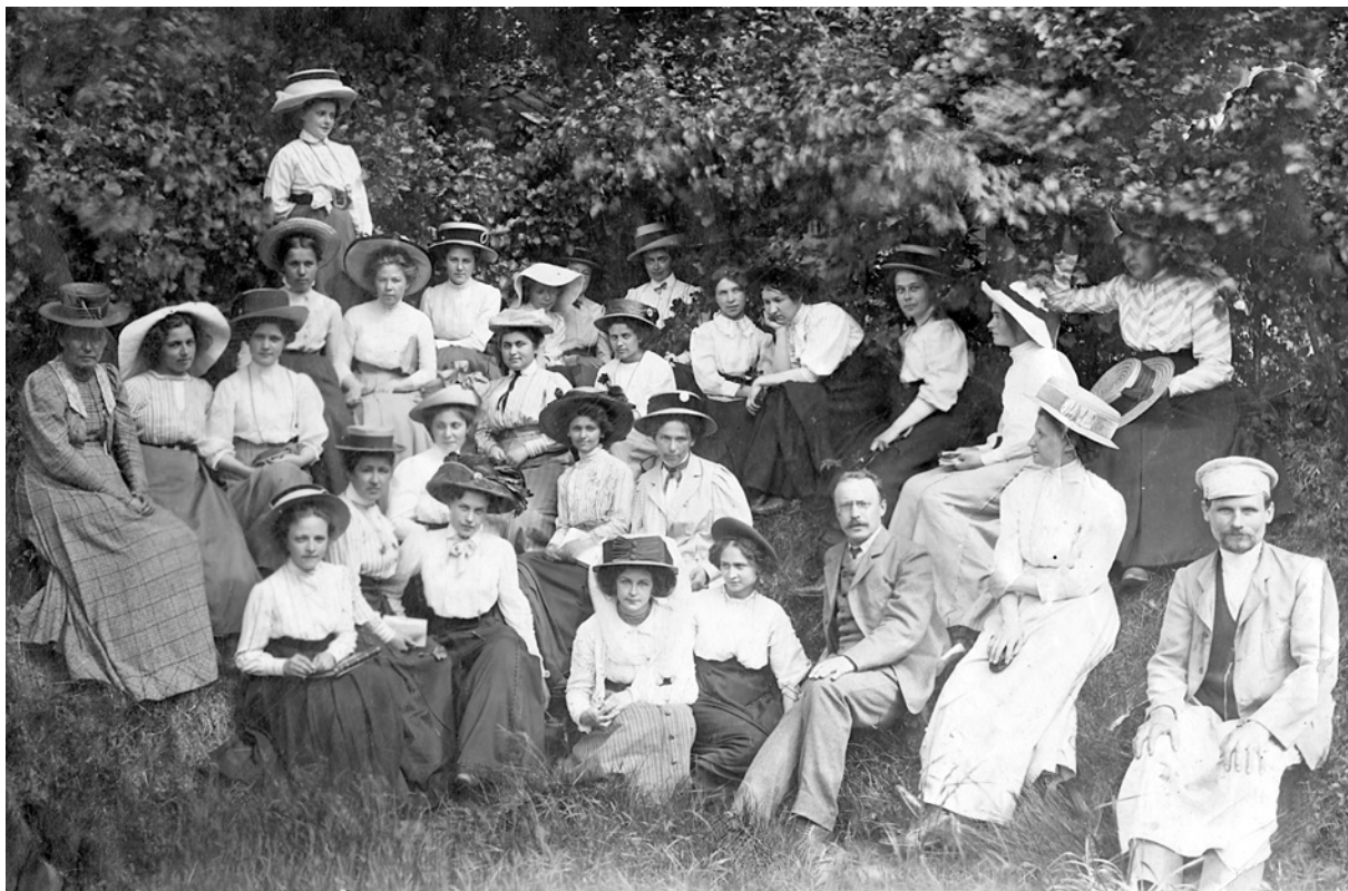
Вихованки пансіону благородних дівчиць на природничій екскурсії на дачі Бернара (Приорка)

Ми можемо повністю довіряти М. Чалому, бо після знайомства на квартирі їх спільного з