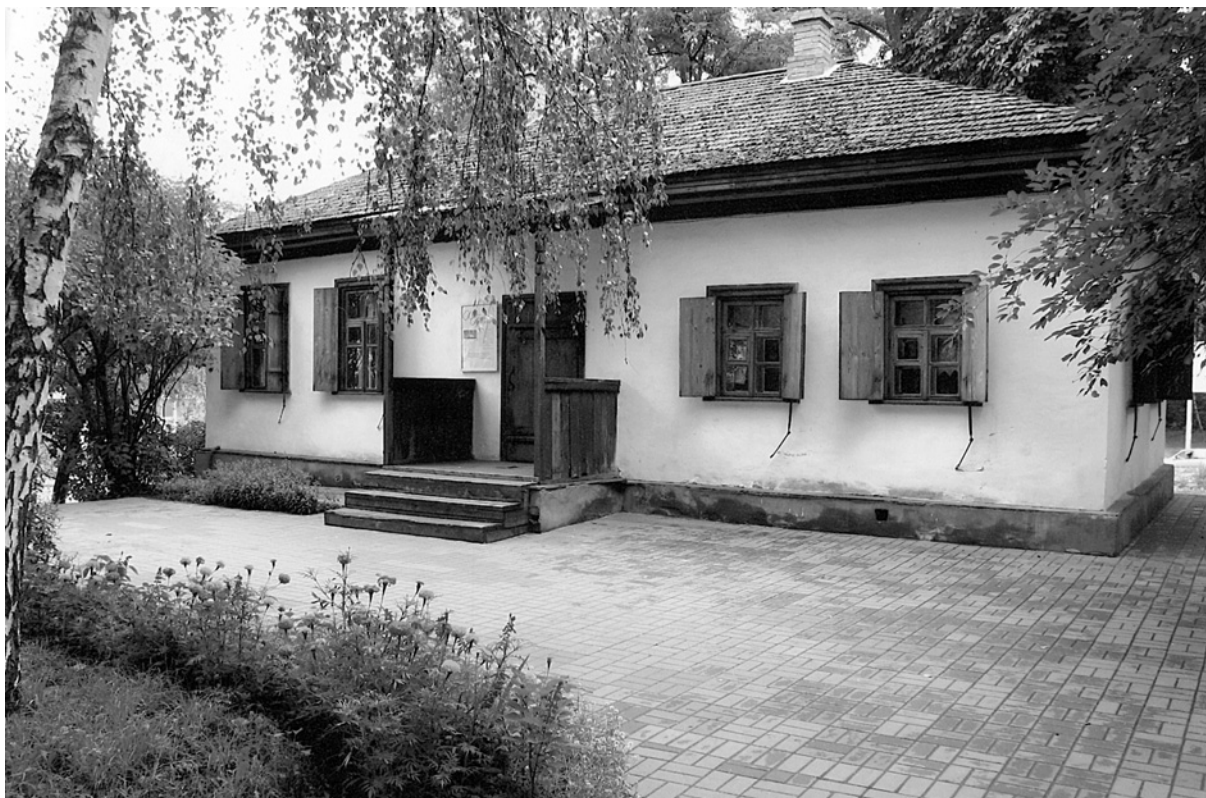
Музей "Хата на Пріорці" (сучасний вигляд)

Пріорка перейшли у власність Київського магістрату, а магістратські селяни мали платити оброк на користь міста. Згодом посполиті селяни підняли питання про надання їм статусу київських міщан. Передмістя було офіційно введено до меж міста в 1834 р., тому пізніше кияни тлумачили назву "Пріорка" по-своєму, виводячи її із слова "приорати", тобто приєднати до міста.