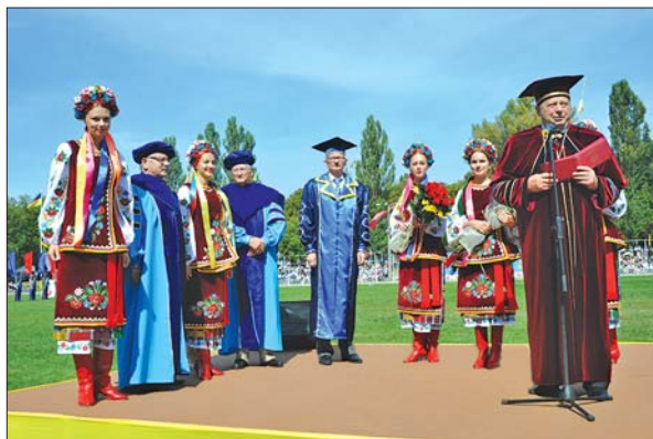
Почесні іноземні гості університету

За результатами цих досліджень було розроблено і впроваджено в практику ветеринарії та медицини, харчової промисловості та кормової сфери низку ефективних препаратів, таких як карбоксилін, МП-15, карбостимулін, медихронал, фоосфомол, різні лікувально-профілактичні напої, запропоновано нові методики досліджень, а також способи діагностики, профілактики й лікування зазначених вище захворювань.