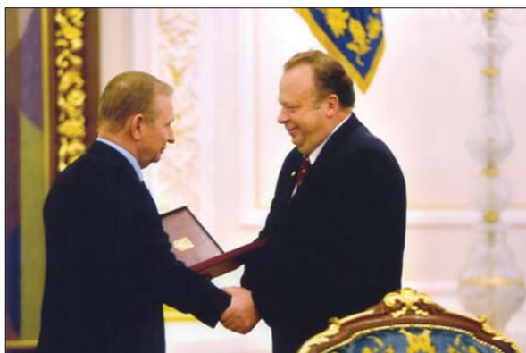
Президент України Л.Д. Кучма вручає Д.О. Мельничуку Зірку Героя України. 2003 р.