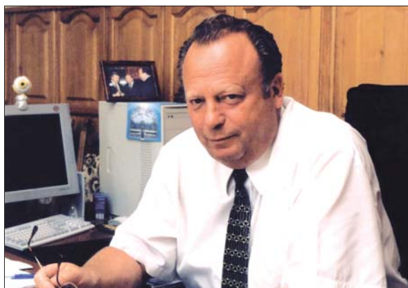
Ректор Національного університету біоресурсів і природокористування України Д.О. Мельничук