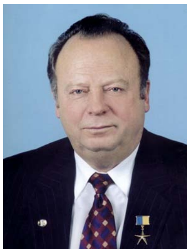
Дмитро Олексійович Мельничук

Сергій Васильович – академік НАН України, в.о. академіка-секретаря Відділення біохімії, фізіології і молекулярної біології НАН України, директор Інституту біохімії ім. О.В. Палладіна НАН України