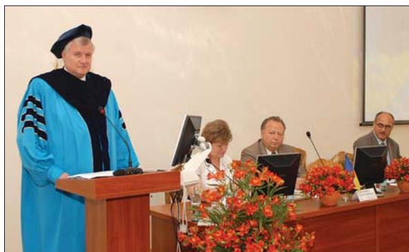
Канцлер Баварії виступає в Національному університеті біоресурсів і природокористування України