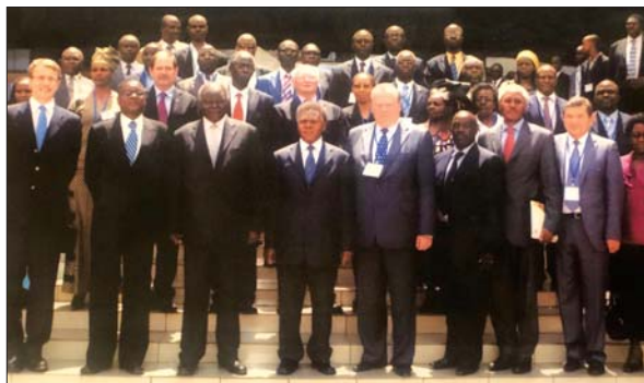
Учасники VI Конференції Всесвітнього консорціуму аграрних університетів і дослідницьких установ (GCHERA). Кенія, 2009 р.