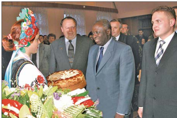
Генеральний директор Продовольчої і сільськогосподарської організації ООН (FAO) Жак Діуф – гість НУБіП України. 2003 р.