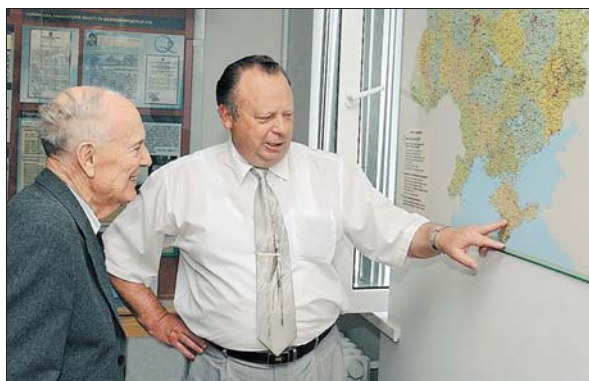
Академік Б.Є. Патон з візитом у НУБіП України