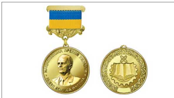
Медаль Національної премії України імені Бориса Патона

з якого походить ціла плеяда непересічних постатей, він завжди викликав зацікавлення журналістів, письменників, дослідників. Низка книжок та статей, що з'явилися протягом кількох десятиліть, висвітлювали різні моменти його довгого і плідного життя.