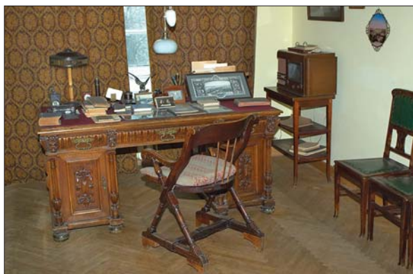
Інтер'єри Меморіального музею академіка Є.О. Патона