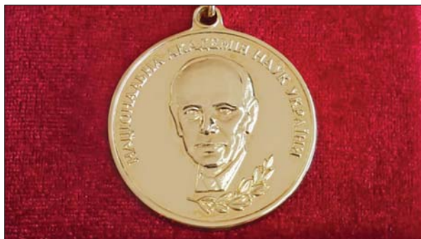
Золота медаль імені Б.Є. Патона НАН України