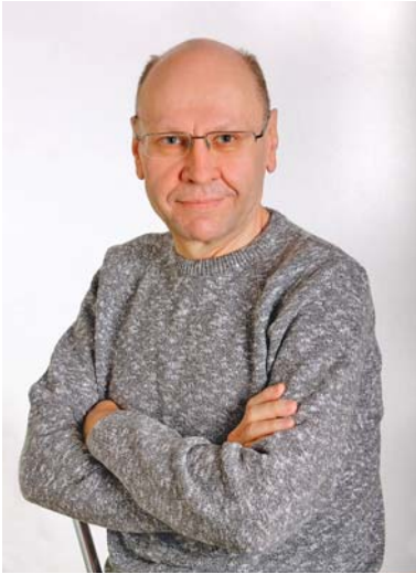
ТОМАЗОВ Валерій В'ячеславович — доктор історичних наук, завідувач сектору генеалогічних та геральдичних досліджень Інституту історії України НАН України