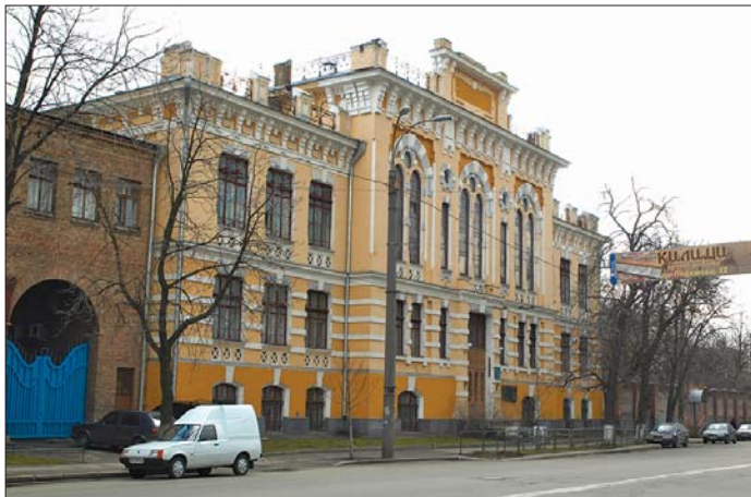
Будівля головного корпусу Інституту електрозварювання ім. Є.О. Патона НАН України