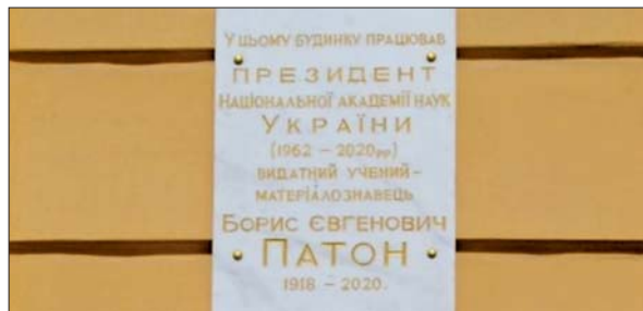
Меморіальна дошка Б.Є. Патону на будівлі Президії НАН України

11 грудня 1984 р. наказом дирекції Інституту електрозварювання ім. Є.О. Патона в головному корпусі (вул. Володимира Антоновича, 69) було створено Музейний комплекс Інституту, який розмістився у 5 залах на площі 350 м 2 . Завдяки наполегливій праці цілої плеяди дослідників зібрано експозицію, яка розповідає про