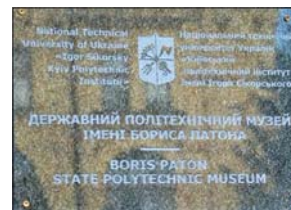
Меморіальні дошки Б.Є. Патону на території НТУУ «Київський політехнічний інститут імені Ігоря Сікорського»: на будинку, де він народився, і на будівлі Державного політехнічного музею