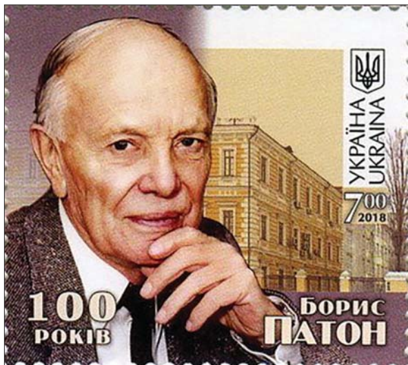
Поштова марка, присвячена 100-річчю Бориса Євгеновича Патона