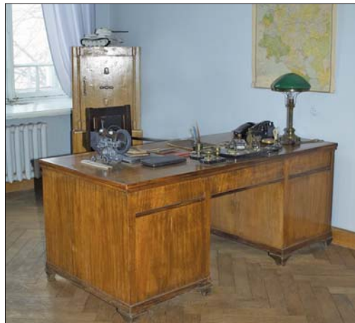
Робочий кабінет академіка Є.О. Патона у Меморіальному музеї вченого