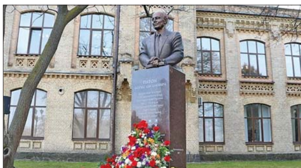
Пам'ятник Б.Є. Патону на території НТУУ «Київський політехнічний інститут імені Ігоря Сікорського»