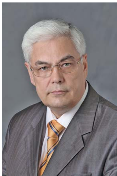
ПИРОЖКОВ Сергій Іванович – академік НАН України, віцепрезидент НАН України, голова Секції суспільних і гуманітарних наук НАН України