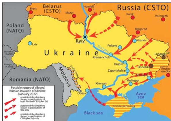
Рис. 1. Карта із зображенням імовірних російських планів вторгнення в Україну, складена за матеріалами, опублікованими незалежно виданням Bild ( http://surl.li/kyjhmi ) і Центром стратегічних і міжнародних досліджень (CSIS) ( http://surl.li/kyjib )

Зона проведення антитерористичної операції (АТО) охоплювала Донецьку і Луганську області, а також Ізюмський район та м. Ізюм Харківської області. Одним із перших завдань АТО було звільнення Слов'янська.