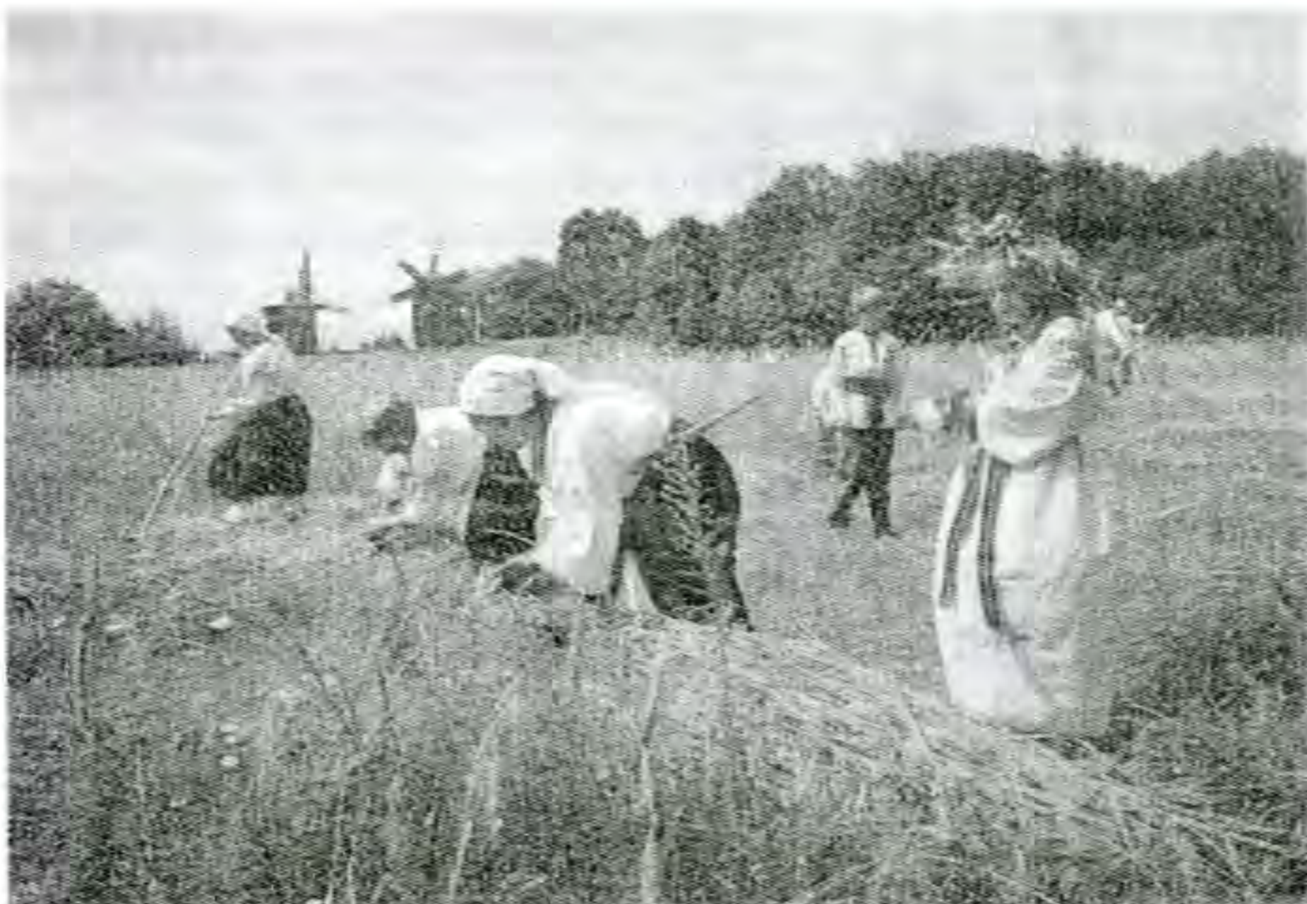
Жнива в Україні (збирання врожаю на ділянках Музею народної архітектури та побуту України). (Далі назву музею подаємо скорочено — МНАПУ).

В Музеї можна побачити унікальні зразки верстатів: “ковч” для вялення сукна вручну, “керат” (соломорізку з кінним приводом), колодочну гвинтову олійницю, колекцію землеробської техніки — сохи, рала, плетені борони, дерев’яні плуги, різноманітної конструкції жорна, ступи. Тут і колекція знарядь пристосувань з рибальства, довбані човни, знаряддя обробки дерева та хатній і господарський дерев’яний посуд, плетений з соломи, берести, дранки, корінців сосни тощо.