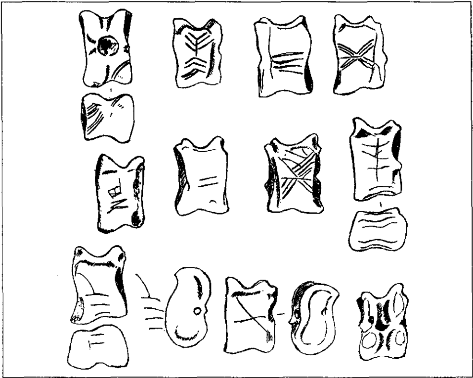
Рис. 3. Астралаги зі знаками з поселення VIII—IX ст. біля с. Зарічне Сумської обл.

принаймні наявність якихось загальних уявлень у цих зонах, імовірно за все, що мають східне (у широкому розумінні) походження. Серед іншого, слід зазначити подібність багатьох мотивів, які використовували для маркування астралагів на значній території не тільки східноєвропейської, а й ширше, євразійської лісо-степової й степової зон. Виходячи із зазначеної ситуації, можна вважати, що гра в астралаги могла займати приблизно однакове місце у світогляді слов'ян та ірано-і тюркомовного населення євразійських степів. При цьому правомірно припустити, що саме східна традиція могла якоюсь мірою вплинути на виникнення відповідної слов'янської (принаймні, слов'янської лісо-степової). У багатьох ірано- і тюркомовних народів уявлення про сакральну значущість астралагів та ігор з ними зберегли виразний характер аж до етнографічної сучасності. Більш різноманітними є тут і самі ігри з астралагами. Значущість згаданої ігрової традиції для цих народів дає змогу говорити про її ймовірну споконвічність в їхньому середовищі. Наведене робить правомірним звернення до традицій гри з астралагами, що збереглися переважно в Азії, для реконструкції, хоча б на загальному рівні, змісту відповідних слов'янських ігор.