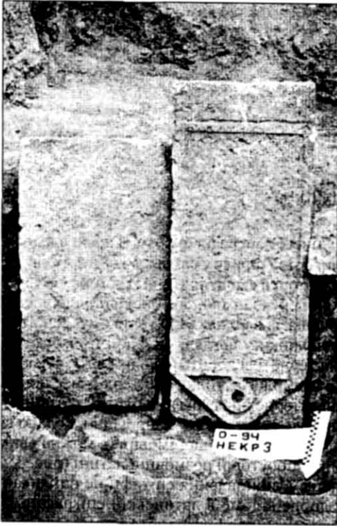
Рис. 1. Надгробна стела з епітафією в закладі підбійної могили № 5