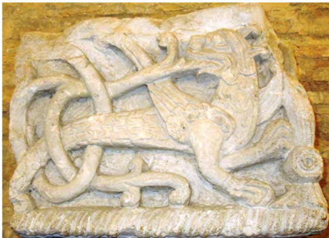
Мал. 1. Кутовий камінь із зображенням фантастичного звіра. Борисоглібський собор у Чернігові.

У 1948 р. під час досліджень Борисоглібського собору поч. XII ст. в Чернігові було знайдено різьблений архітектурний блок із вапняку з рельєфними зображеннями птаха та фантастичного звіра у плетиві (мал. 1). Ця знахідка одразу привернула до себе увагу завдяки художній досконалості виконання та незвичності для регіону Північного Лівобережжя.