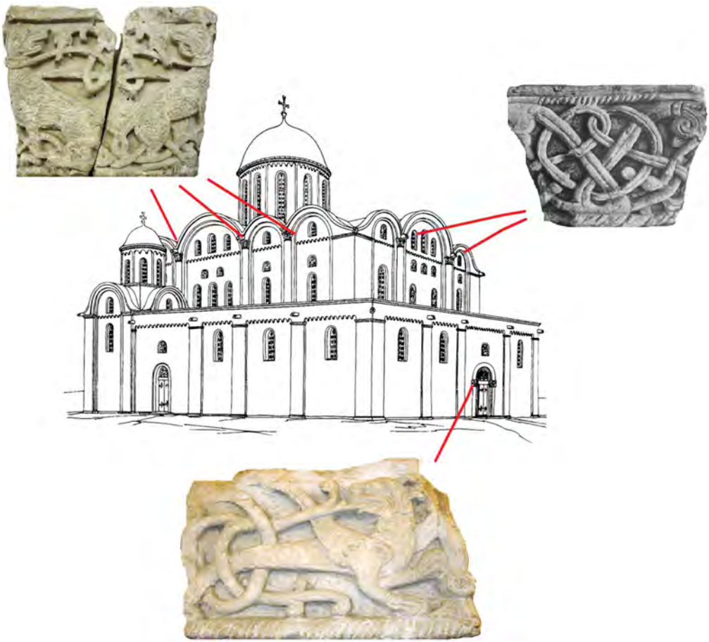
Мал. 4. Схема розміщення білокам'яних рельєфів на фасадах Борисоглібського собору відповідно до реконструкції М. Холостенка.

Вивчення місць давніх копалень засвідчує, що під час видобутку каменю з моноліту породи вирізали блоки різноманітної форми, відповідно до майбутнього призначення. Остаточна їх обробка відбувалася згодом на будівельному майданчику. Така технологія є в цілому характерною для Середньовіччя (наприклад, у Східній Європі вона практикувалася під час видобутку пірофілітового сланцю на Волині 28 ).