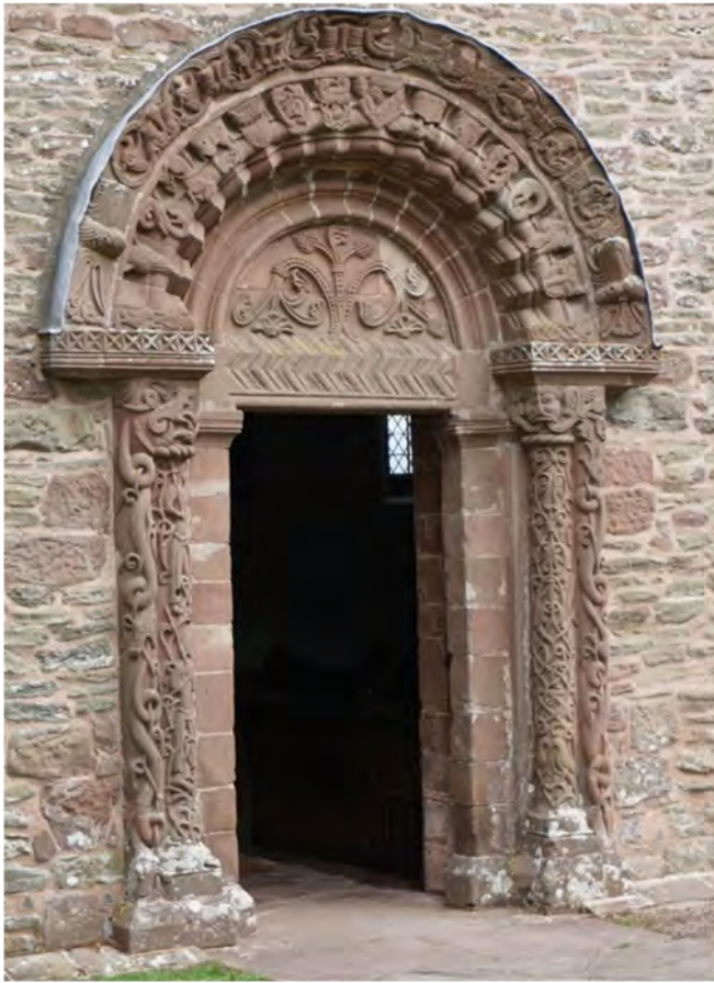
Мал. 8. Південний портал церкви св. Марії та св. Давіда, Килпек (Херфоншир, Англія). XI ст.