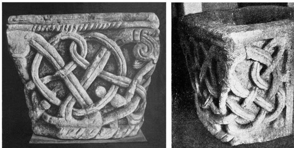
Мал. 2. Капітель, знайдена 1860 р. у Борисоглібському соборі.