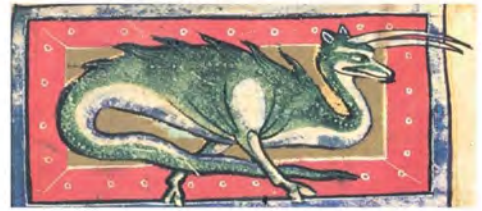
Мал. 5. Грифоподібні та драконоподібні істоти з англійського «Бестиарію» кінця XII ст. (за факсимільним виданням під ред. К. Муратової).