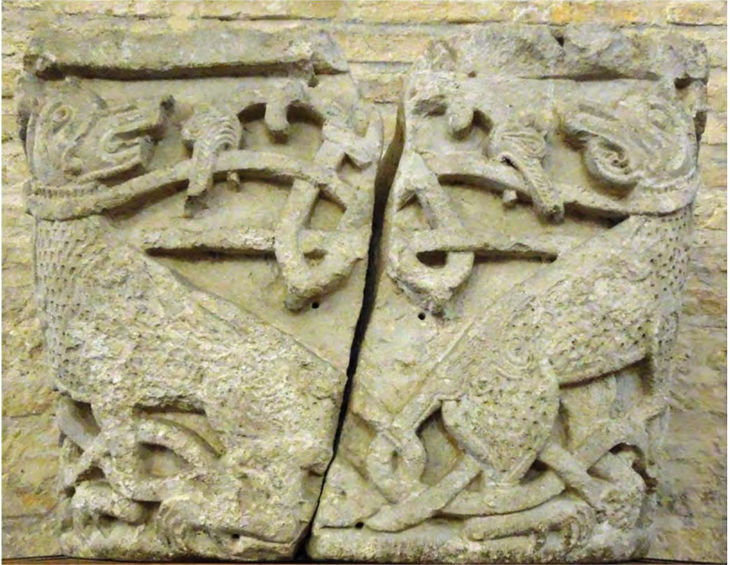
Мал. 3. Капітель із зображенням тварин з Борисоглібського собору.

значити, що всі знайдені у Борисоглібському соборі різьблені архітектурні блоки мали сильне поверхнєве забруднення та втрати. Капітель із зображенням звірів (мал. 3) виявився розколотою на кілька фрагментів унаслідок (як вважав М. Холостенко) падіння з висоти 18 . Напевно, на момент відновлення собору домініканцями всі ці різьблені камені знаходились у розвалах стін.