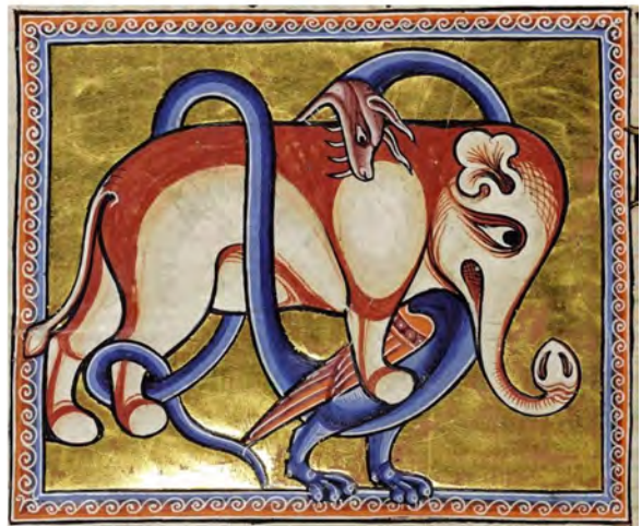
Мал. 6. Звірі, пантера та дракон. Мініатюра Рочестерського «Бестиарію» другої чверті XIII ст. (Британська бібліотека, Royal MS 12 F XIII, f. 9).